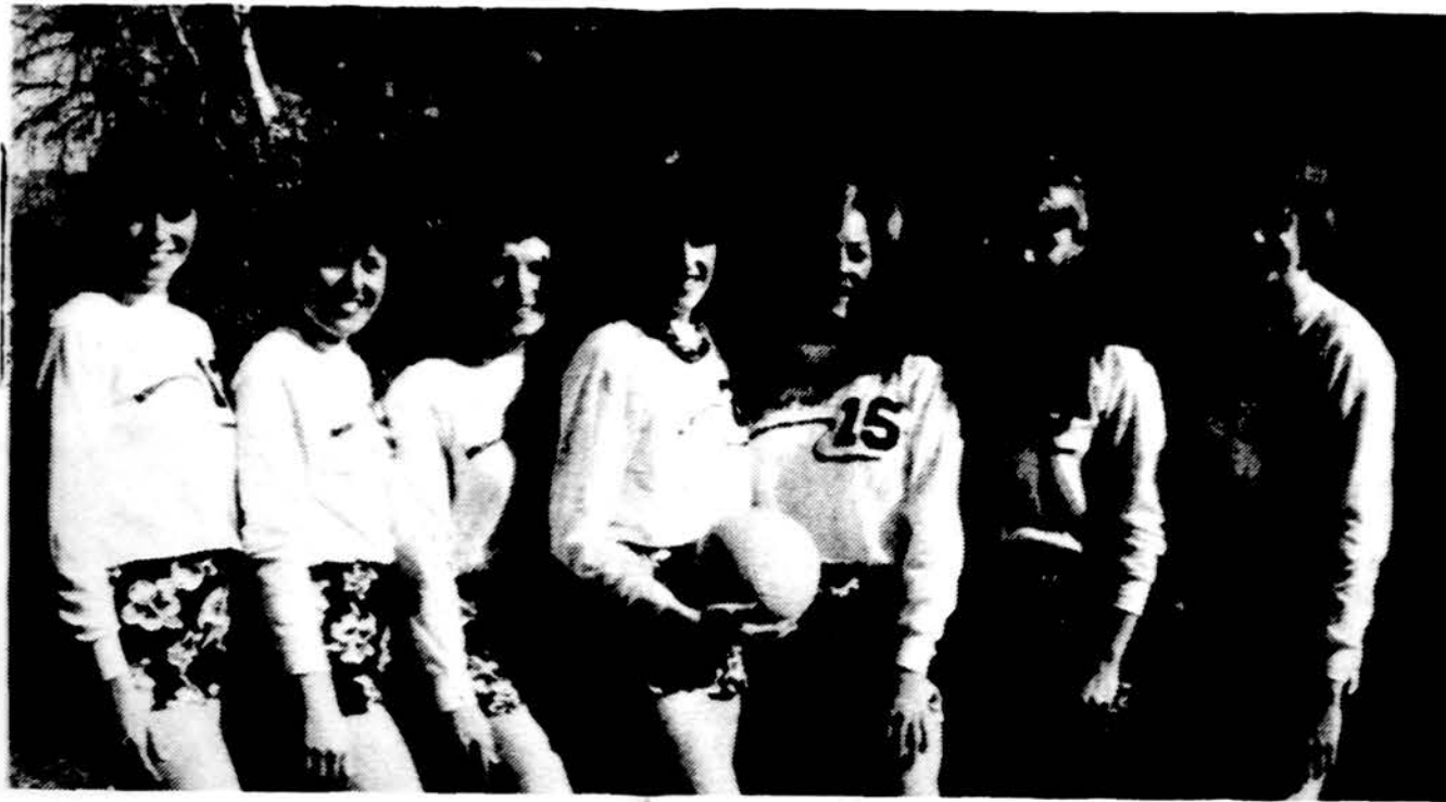
Los Angeles moterų tinklinio komanda „Banga“ ruošiasi dalyvauti balandžio 13-14 d. Detroito vyksiančiose 35-tose S. Amerikos Lietuvių Sporto žaidynėse.