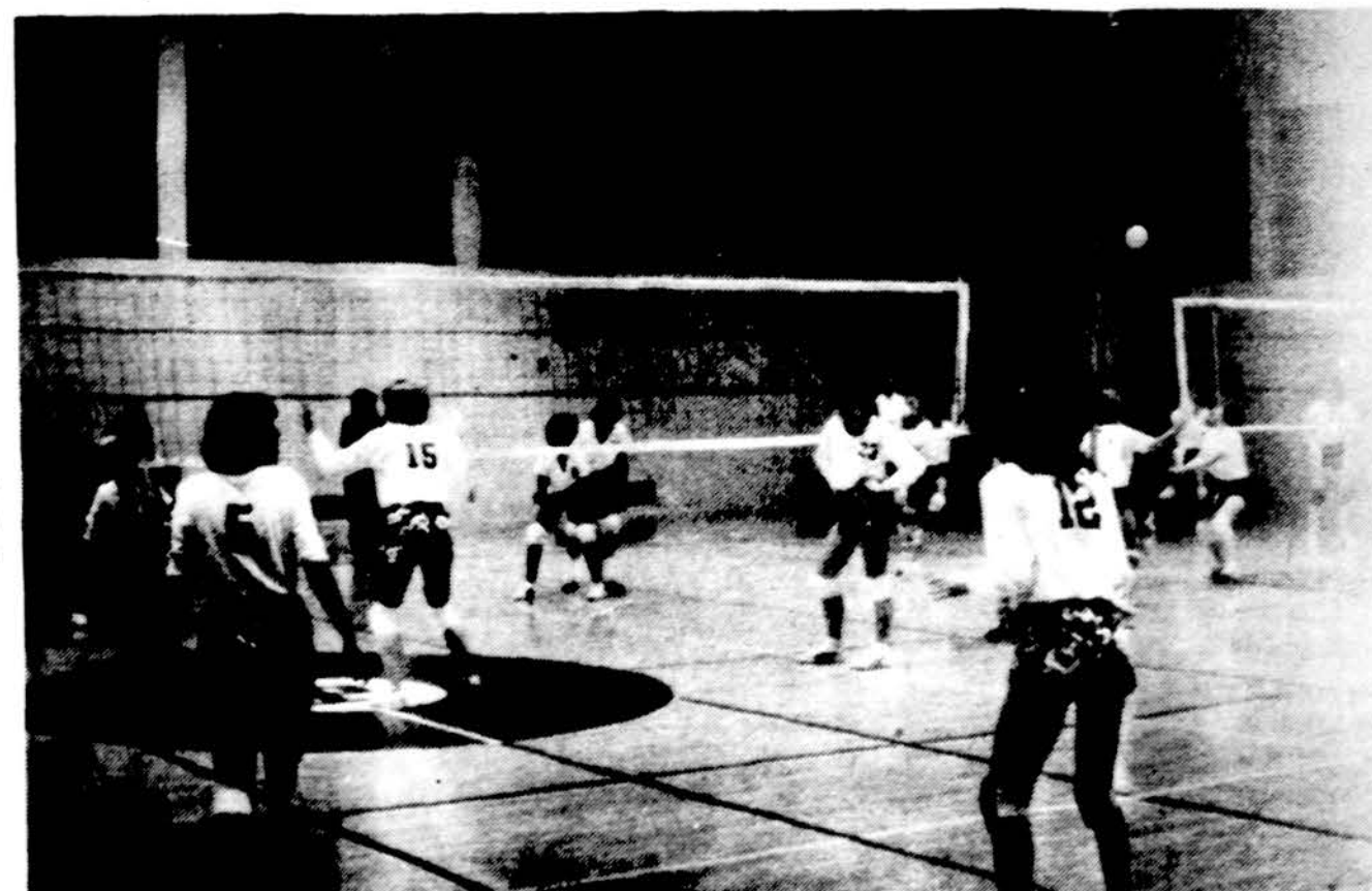
Los Angeles „Bangos“ žaidėjos tinklinio aikštėje.

Europos Taurių varžybų pusfinalio rungtynėse prieš Prancūzijos ASVEL komandą „Žalgiris“ Kaune vykusiose rungtynėse buvo laimėjęs 84:78. Praėjusį antradienį Lyone vykusias antrąsias rungtynes „Žalgiris“ pralaimėjo 93:88, vienu tašku mažiau, negu buvo laimėjęs Kaune. To ir užteko, kad patektų į finalą. Finalinės rungtynės bus kovo 19 d. Grenoblyje prieš Barceloną. Rungtynės buvo labai įtemptos. Paskutinėse sekundėse prancūzai prametė dvi baudas ir metimą. Rungtynes stebėjo 10,000 žiūrovų. Vakar „Žalgiris“ Maskvoje žaidė pirmas rungtynes prieš Maskvos CASK dėl Sovietų Sąjungos meistro titulo. Antrosios rungtynės, ir jei reikės trečiosios, ateinantį savaitgalį vyks Kaune. Meistro titului reikia dviejų pergalių.