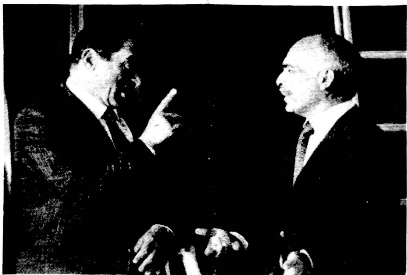
Egipto prezidentas Hosni Mubarak kalbasi su Jordano karaliumi Husseinu. Jordanas atnaujino diplomatinis ryšius su Egiptu tik pernai rugsėjo mėnesį, tačiau nuo to laiko karalius jau ketvirtą kartą susitiko su prezidentu Mubaraku. Abu jie ragina Ameriką aktyviau įsijungti į taikos procesą ir pradėti derybas su Palestiniečių Laisvinimo Organizacija. Izraelis griežtai atsisako deryboms su PLO, kurią vadina „terroristais“.