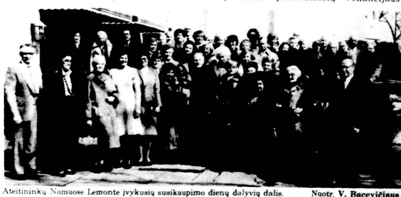
Ateitininkų Namuose Lemonte įvykusiu susikaupimo dienų dalyvių dalis.