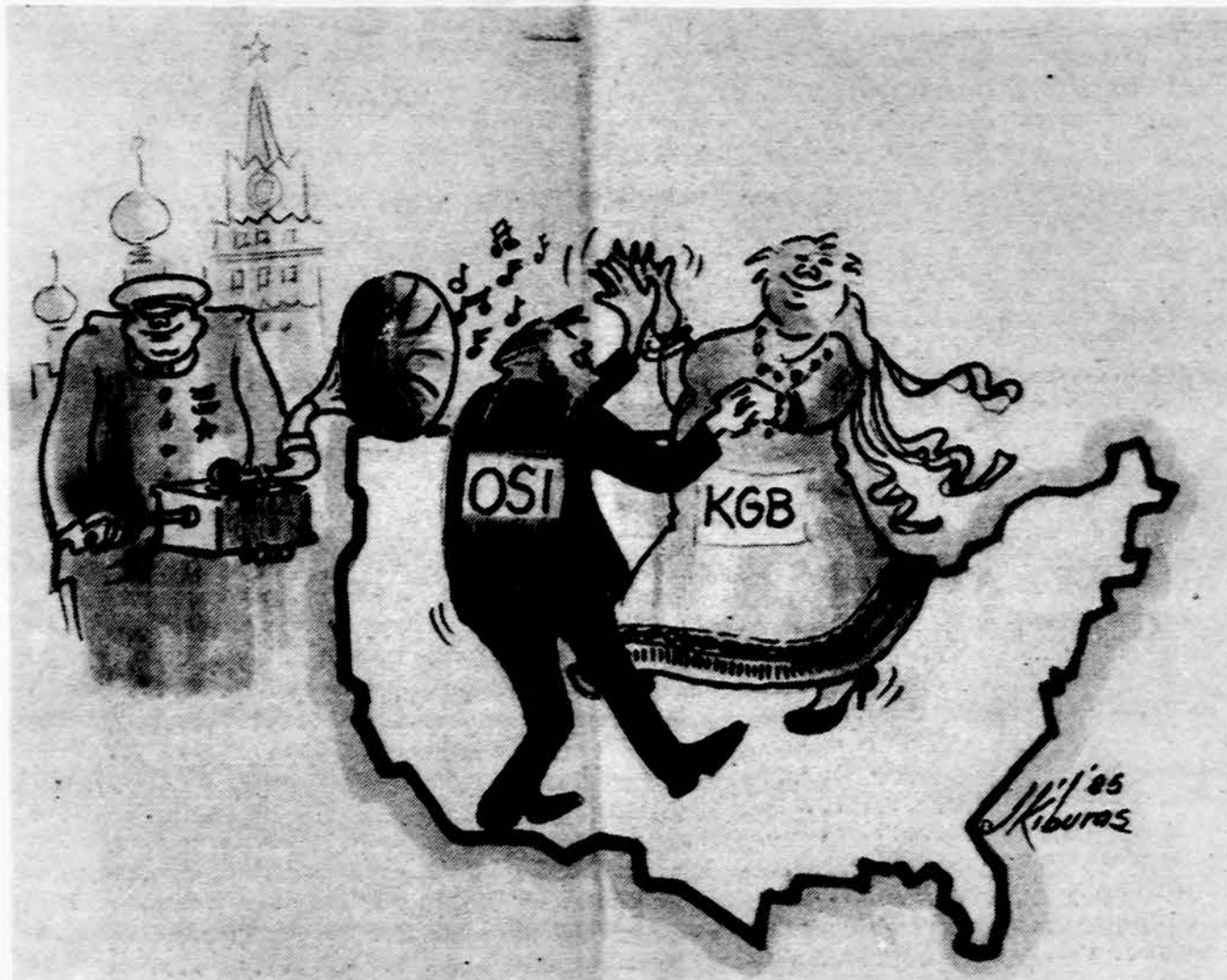
Karikatūrininko žvilgsnis į JAV teisingumo departamentą bendradarbiaujant su sovietų saugumo milicija.