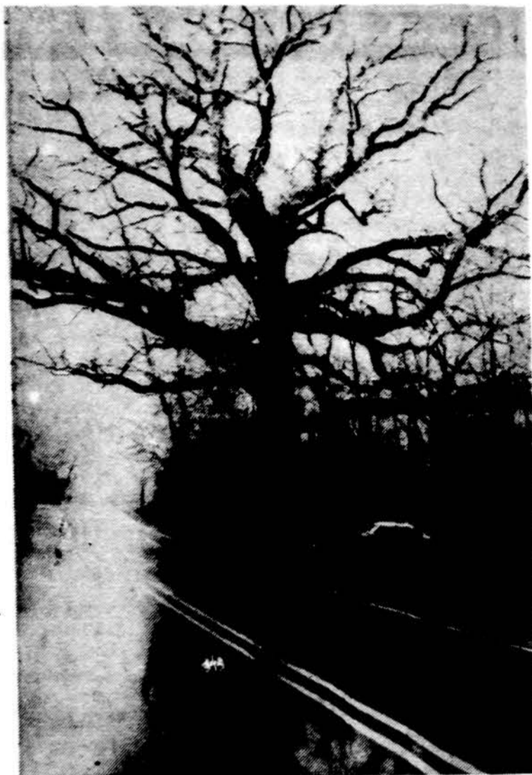
Pagarsėjęs Dainavos stovyklos ažuolas anksti pavasarį.