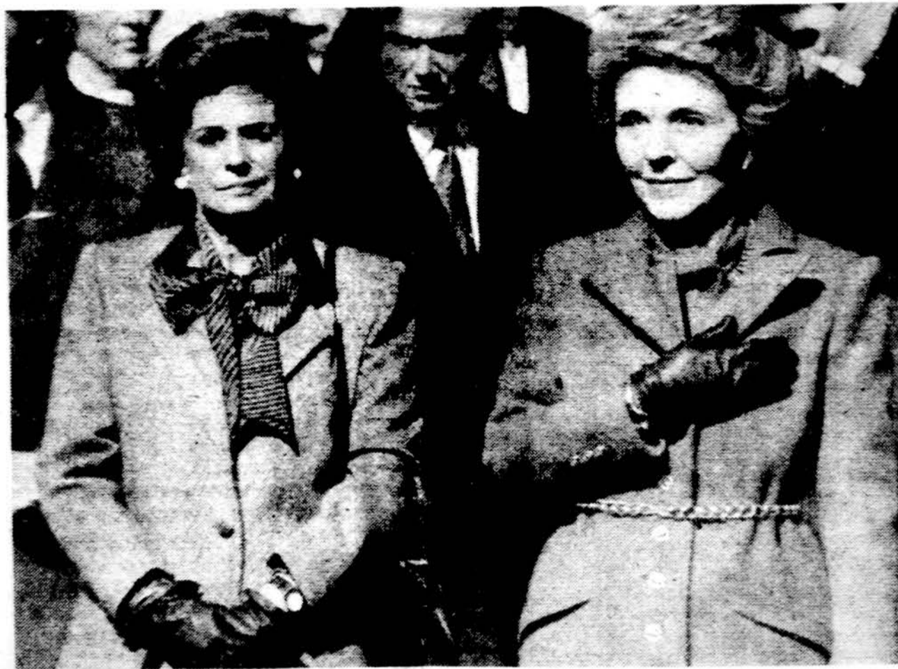
Argentinės prezidento Raulo Alfonsino žmona Maria Lorenza Barreneche de Alfonsin ir Nancy Reagan Baltųjų Rūmų ceremonijoje, kuriose buvo sutikti Argentinės svečiai.

Washingtonas. — Po kietų debatų Senatas 55-45 balsais patvirtino lėšas MX daugia- galvėms raketoms. Prezidentas Reaganas prieš balsavimą aplankė senatorius ir ragino juos neatimti iš Amerikos delegacijos Ženevos derybose stiprios „kortos“ — naujųjų MX raketų. Jų finansavimas parodys pasauliui Amerikos pasiryžimą išlaikyti taiką ir saugumą. Stebėtojai mano, kad lėšas toms raketoms patvirtins ir Atstovų Rūmai.