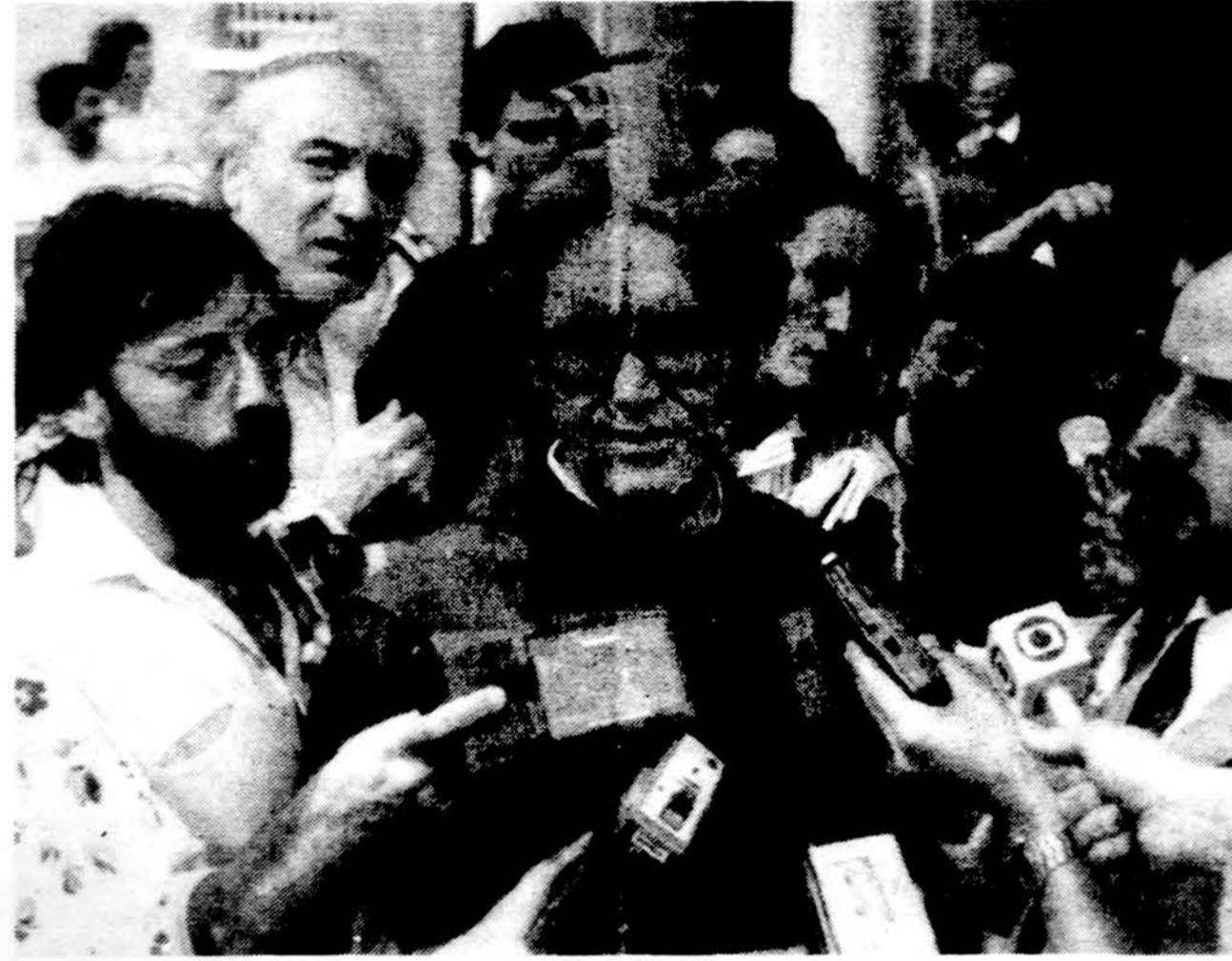
Vatikano Tikėjimo doktrinos kongregacijos pasmerkta Brazilijos teologas kun. Leonardo Boff, apsuptas reporterių, pareiškė, kad jis, kaip katalikas ir pranciškonas vienuolis klausys ir prisiderins. Jis noris eiti kartu su Bažnyčia, o ne žygiuoti atskirai su savo teologija. Vatikano dokumentą, smerkiantį „išlaisvinimo teologiją“, pasirašė kardinolas Joseph Ratzinger.