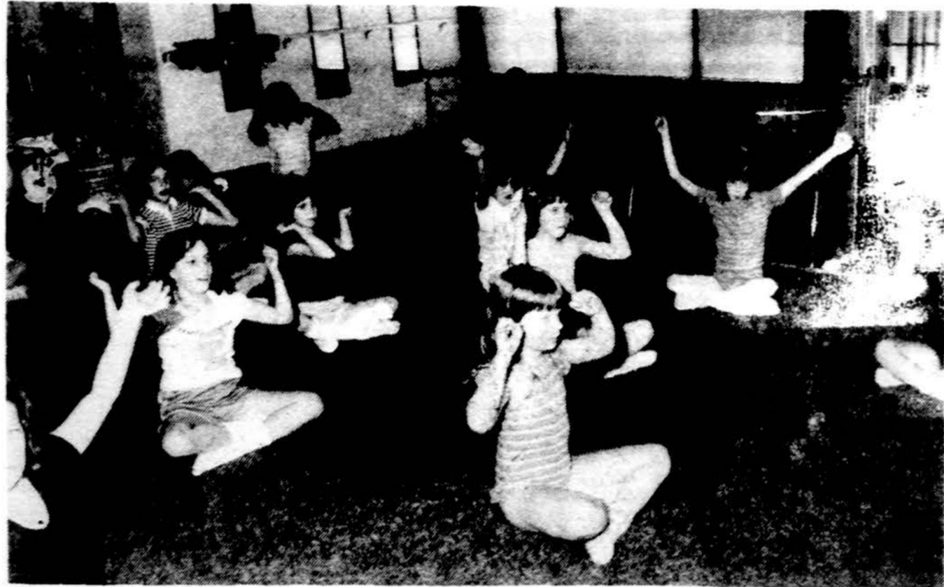
Būsimos sportininkės — „Aušros Vartų“ tunto paukštytės mankštos pamokoje.