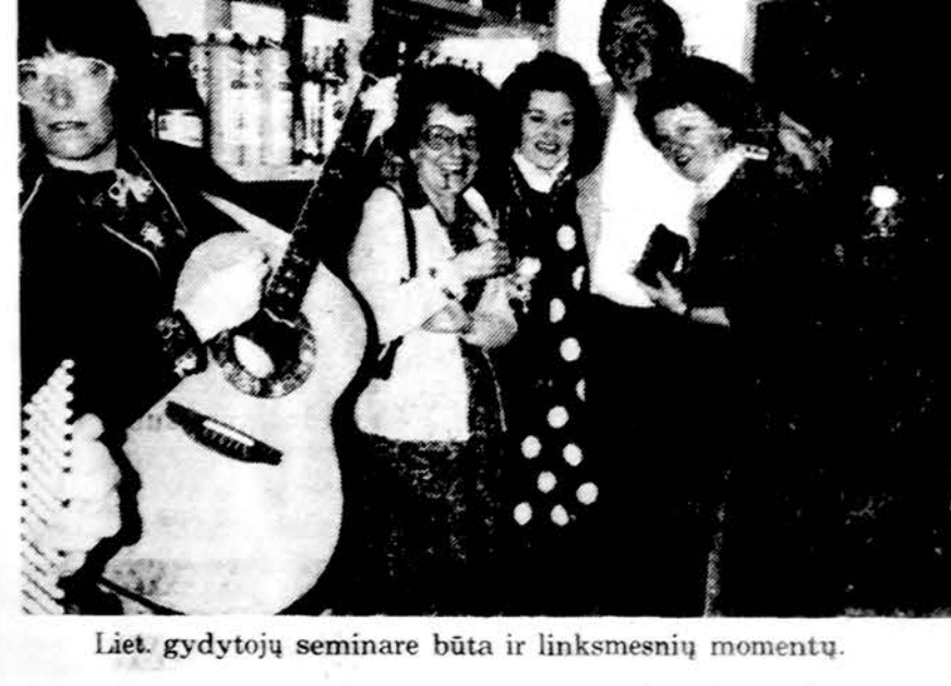
Liet. gydytojų seminare būta ir linksmesnių momentų.