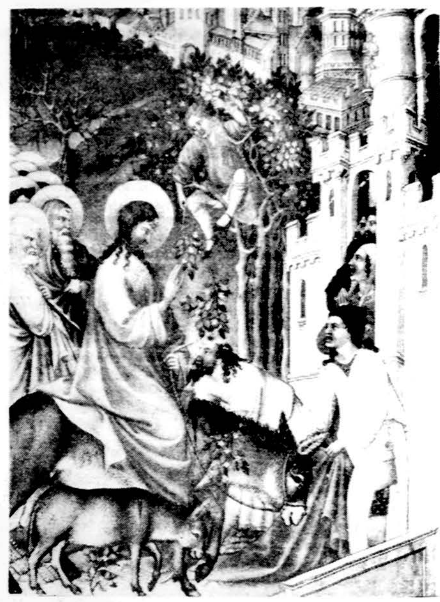
PALMIŲ SEKMADIENIS. Kristaus įžengimas į Jeruzalę. Iš senos miniatiūros