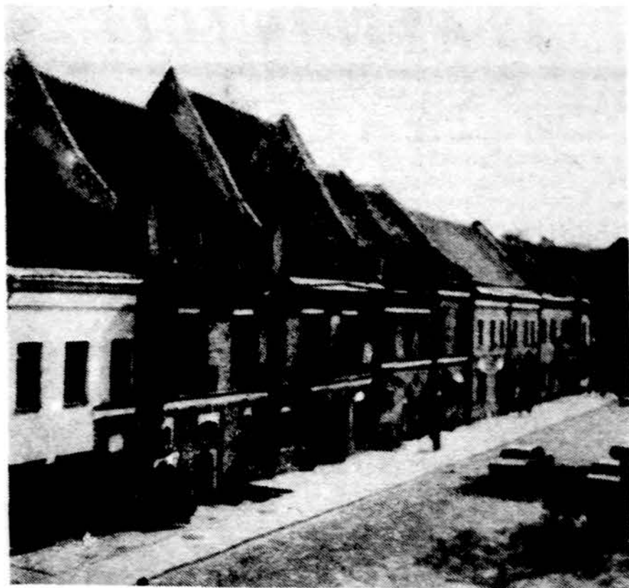
Kaunas. Rotušės aikštės restauruotas kampelis.