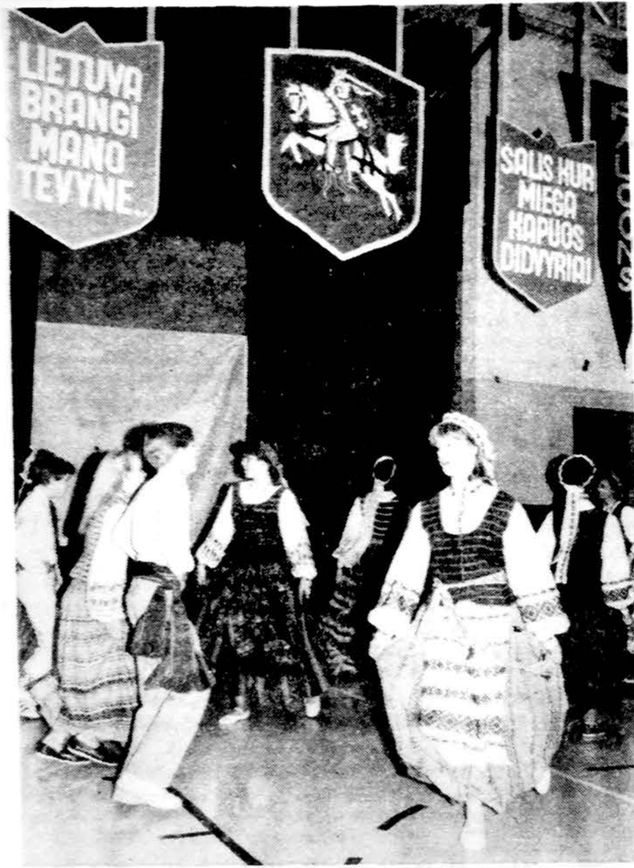
Lemonto jaunimas, pamėgęs lietuvių tautinius šokus