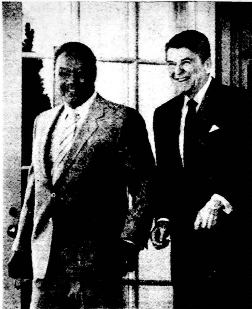
Pažadėjo Reaganas priėmė Sudano prezidentą Gaafar al Nimeirį ir pažadėjo jam 67 mil. dol. paramos. Sudano prezidentui svečiuojantis Amerikoje, namie prasidėjo riaušės, streikai ir profesionalų (gydytojų, advokatų) bruzdėjimas.