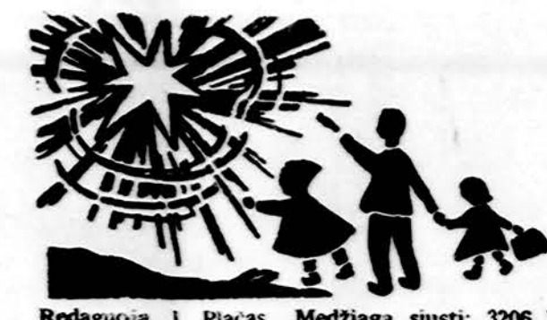
Redaguoja J. Placas. Medžiagą siūsti: 3206 W. 65th Place, Chicago, IL 60629