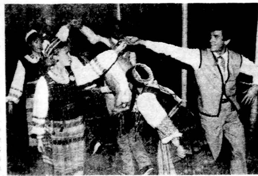
„Rūtos“ šokėjai atlieka programą.