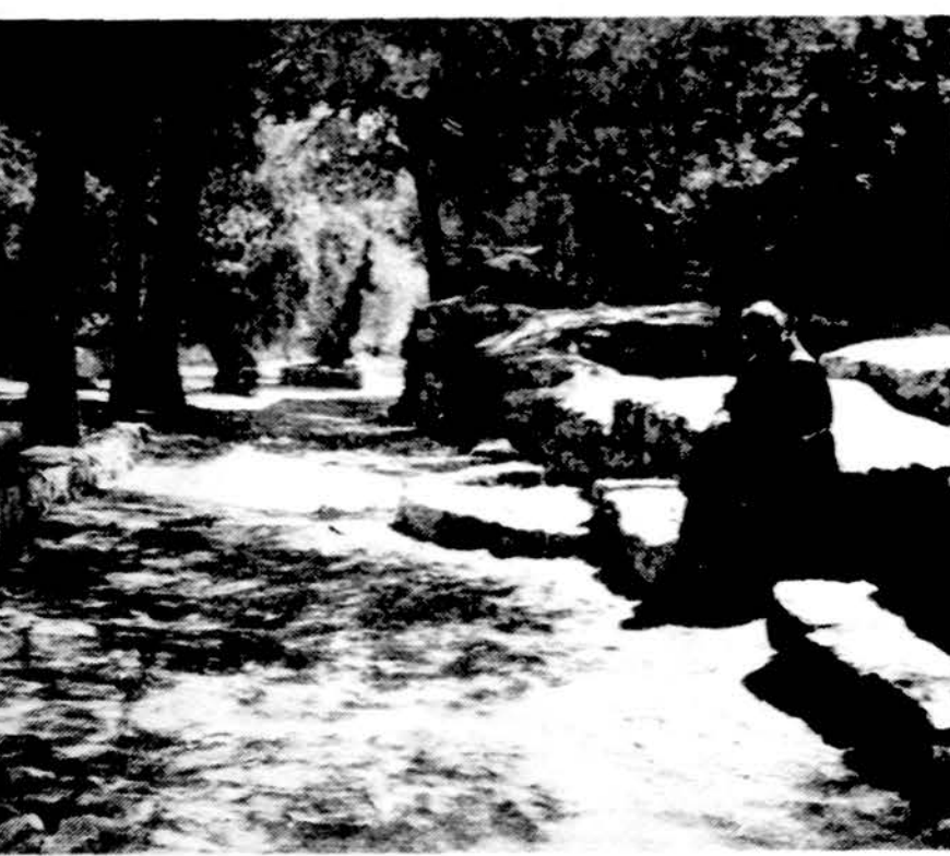
Senasis romėnų kelias, einąs pro Emmaus, kuriuo prieš beveik 2000 metų keliavo Jėzus su dviem mokiniais.

Atsakydamas jis kalbėjo atvirai: tikintieji parapijoje jį boikotuoja, arkivyskupas neleidęs jam dėstyti kunigų seminarijoje, ir gal net mus pačius, tuos, kurie klausėme kursą, tik jau ne akiai priimdami visa, kaip kokie kompiuteriai, kurie užrašo žodžius, o ne pridengtas mintis, ironiją ir grimasas, nepagaudami tikrojo tikslų ir visų niuansų. Mūsų noras buvo kristologijos tema giliai apmąstyti, prapasti ir pasidaryti reikiamas išvadas. Būdami sąmoningais krikščionimis, norėjome pilniau save formuoti, brandinti savo tikėjimą. Mus neramina ne vien krizė katalikų Bažny-