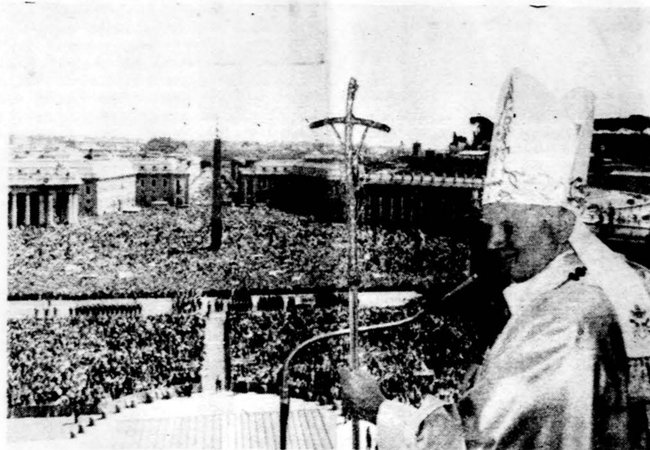
Popežius Jonas Paulius II laimina milžinišką tikinčiųjų minią Šv. Petro bazilikos aikštėje. Savo Velykų kalboje popežius prisiminė II Pasaulinio karo užbaigimo 40 metų sukaktį ir apgailestavo, kad pasaulyje dar nėra taikos. Savo Velykų sveikinimus popežius tarė ir lietuvių kalba.

— Maskvoje lankosi 13 asmenų JAV Atstovų Rūmų delegacija, vadovaujama pirmininko Thomas O'Neill. Jis tikisi susitikti ir su nauju Kremliaus vadovu Gorbačiovu.