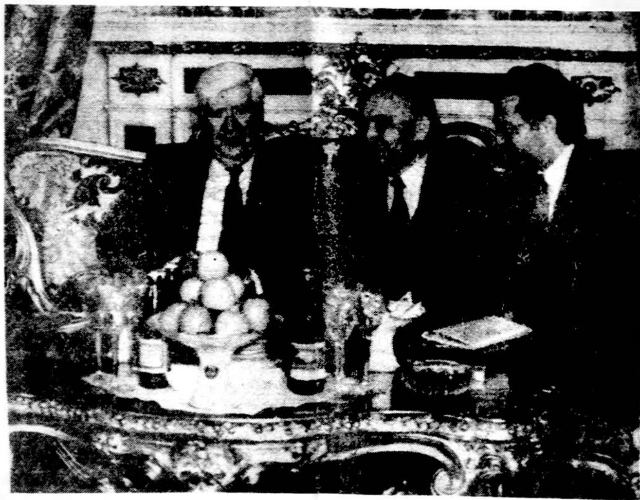
Atstovų Rūmų pirm. Thomas O'Neill su sovietų tautybių tarybos pirm. Lev Tolkunov'u. Šalia jo vertėjas. Vakar amerikiečių delegacija susitiko su užsienio reikalų ministru Gromyka.