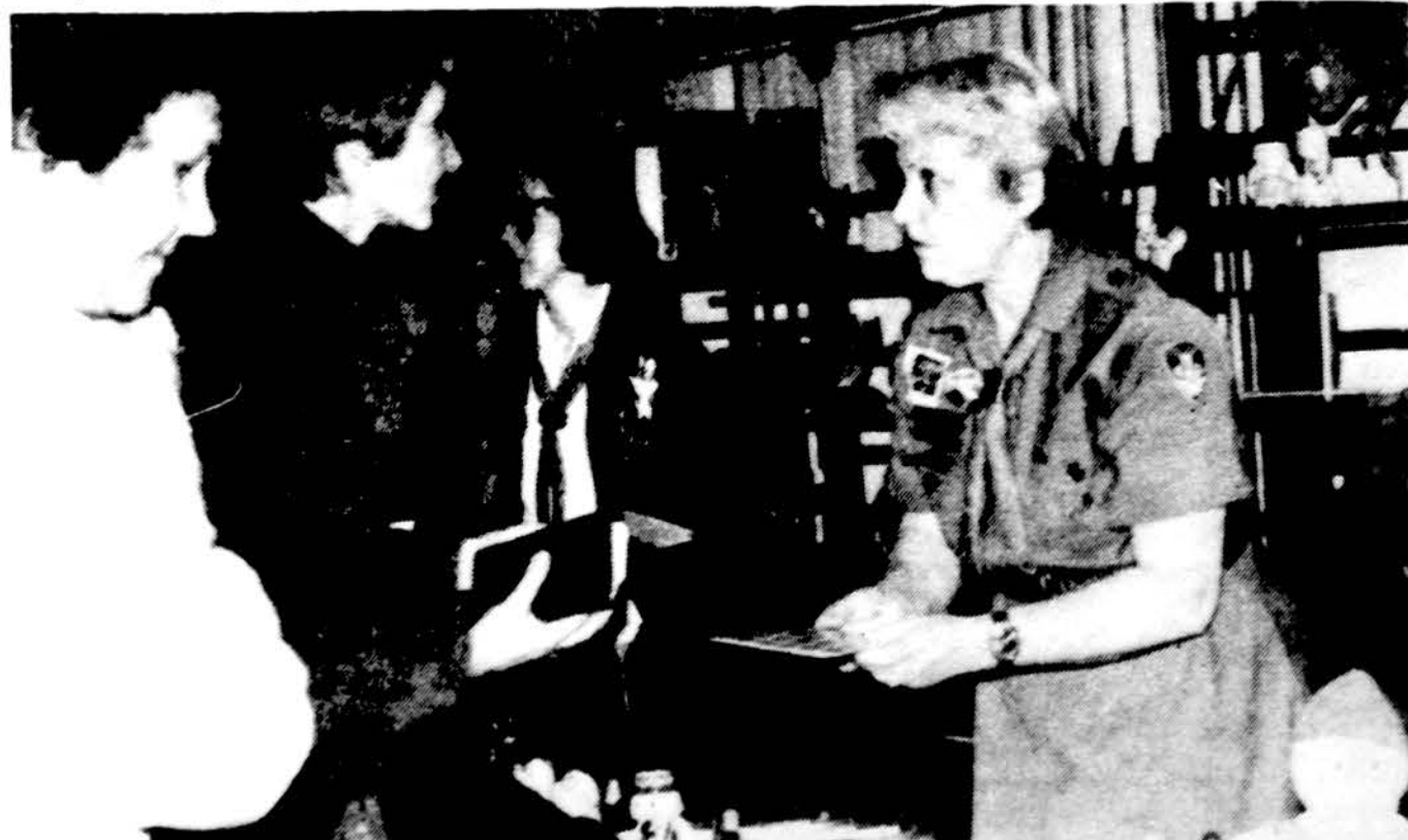
Chicago skautų ir skaučių Kaziuko mugėje prie „Kernavės“ tunto paviljono vyksta gyvos derybos.