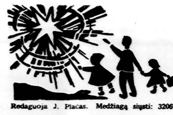
Redaguoja J. Piacas. Medžiagą siūsti: 3206 W. 65th Place, Chicago, IL 60629

Kultūrinę popietę rengia Cicero Lietuvių Bendruomenė.