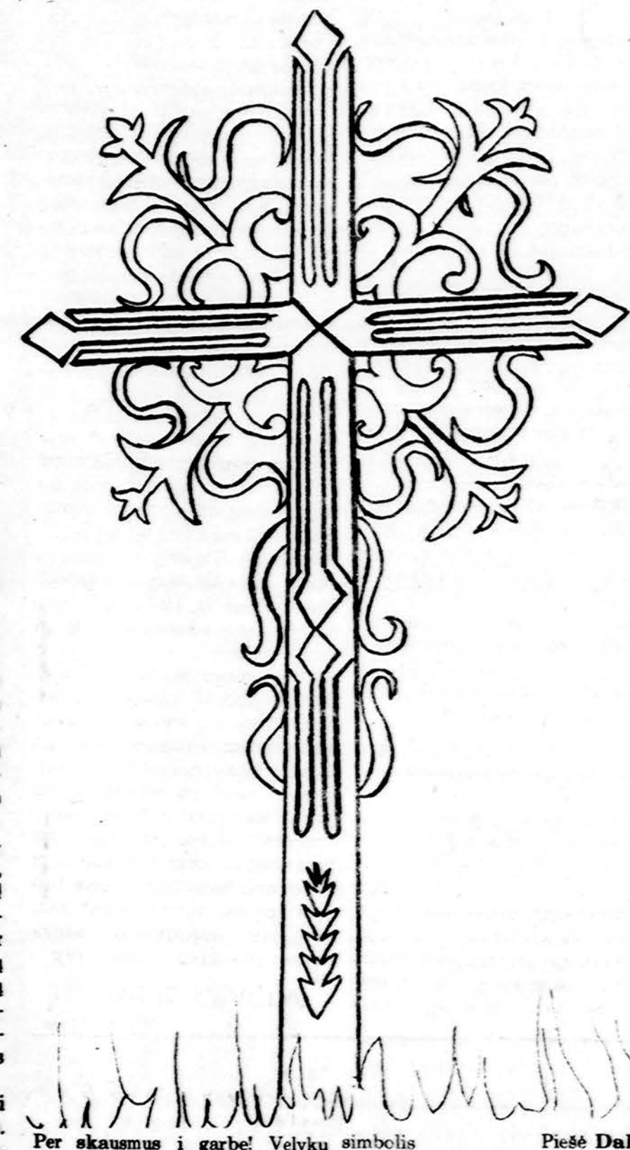
Per skaismus į garbę! Velykų simbolis Piešė Dalė

Isteigtas Lietuvių Mokytojų Sąjungos Chicago skyriaus