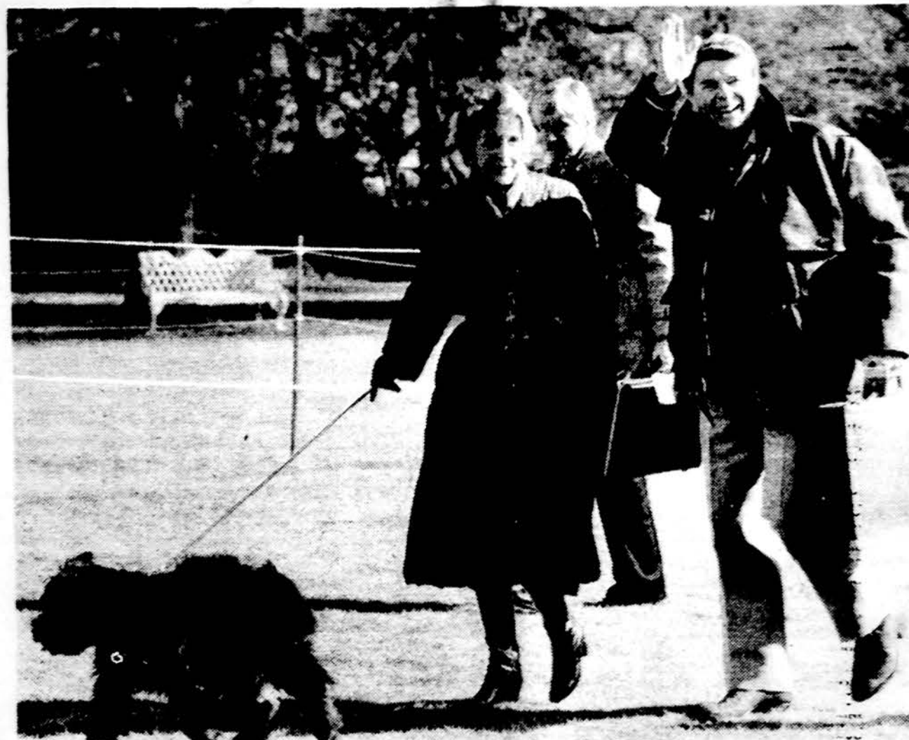
Prezidentas Reaganas su ponia Nancy ir „Lucky“ grįžo po 10 dienų atostogų į Baltuosius Rūmus. Prezidento šią savaitę laukia sunki kovą su Kongreso oponentais, kurie nepritaria biudžeto lėšų karpymams socialinėms programoms, nepritaria lėšų skyrimui Nikaragvos sukileliams prieš sandinistų valdžią. Šeštadienį savo radijo kalboje prezidentas kėlė dar vieną nepopuliarų klausimą, — pajamų mokesčių reformų įstatymą.

Neseniai sekretorius Shultz pasakė Senato komitete, kad Amerikos moralinė pareiga padėti Nikaragvos gyventojams išsiveržti iš už Geležinės uždangos ir susigrąžinti laisvę. Jis pridėjo, kad Centrinėje Amerikoje negalima leisti taikyti Brežnevo doktrina. Kaip žinoma, Brežnevas 1968 m. paskelbė, kad komunistinės valstybės privalo gelbėti komunizmą Čekoslovakijoje, nes jei kartą šalis tapo