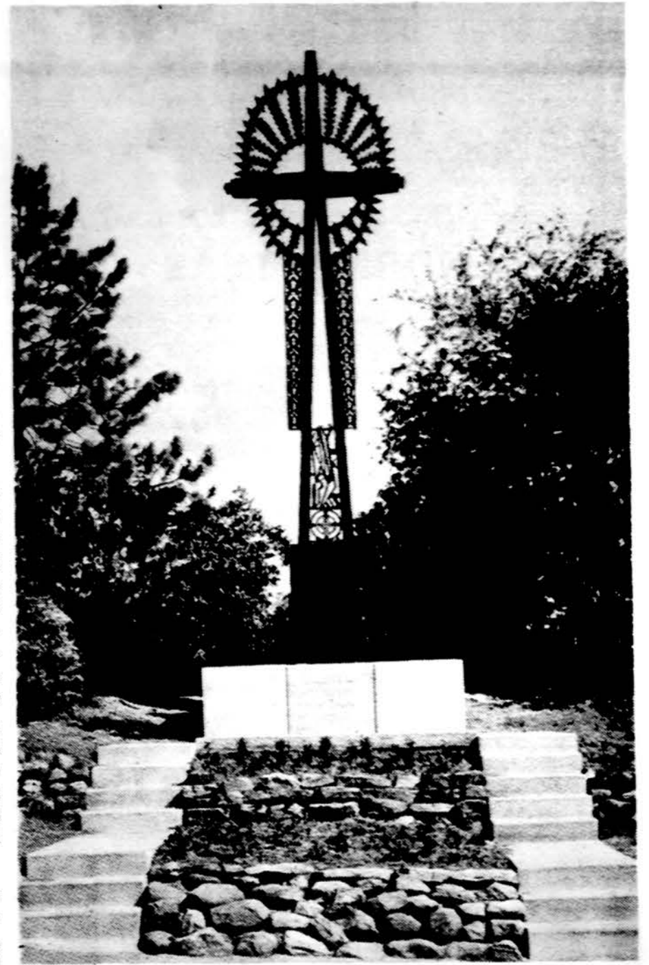
Kiekvieno praeinančio ar pravažiuojančio akys nukrypsta į šį reto gražumo lietuvišką kryžį Kankinių šventovėje, Midland, Ontario, Kanadoje.