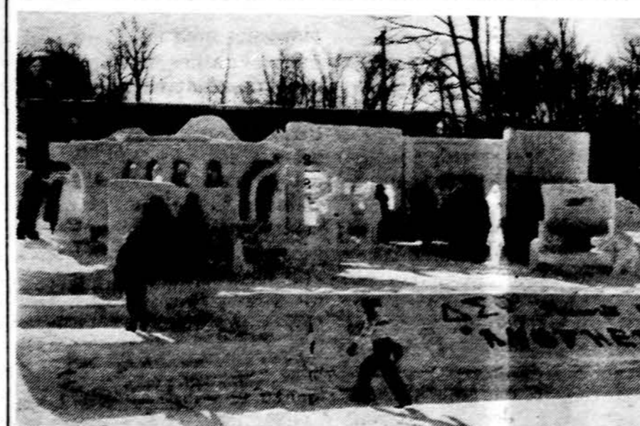
Senovinio miesto fasadas — sniego skulptūros.