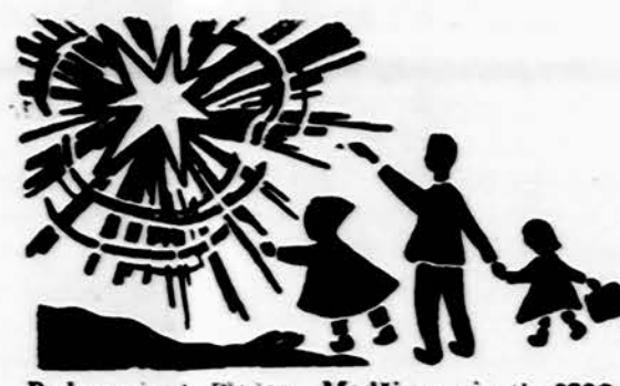
Redaguoja J. Placas. Medžiagą siūsti: 3206 W. 65th Place, Chicago, IL 60629