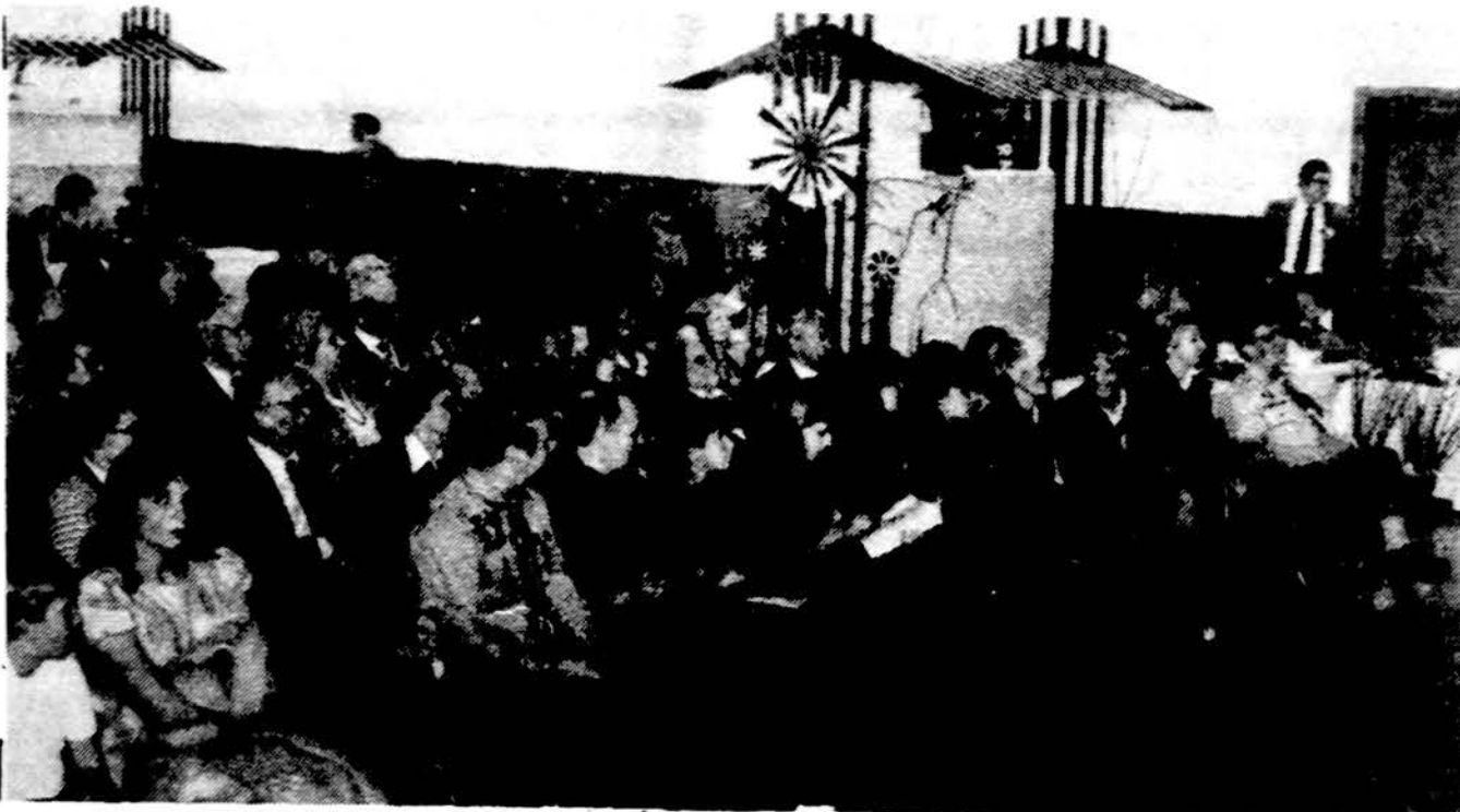
Clevelando Kaziuko mugėje svečiai laukia skautiško pasirodymo.