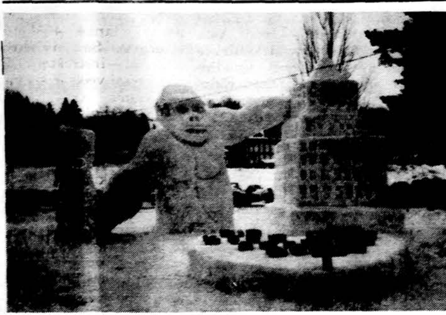
Sniego King Kongas.

Į šį mano laišką Brzezinski atsakė tokiu kovo 27 d. laišku: „Dėkui už Jūsų malonų laišką. Jūs galite būti tikras dėl mano nuolatinės simpatijos ir rūpinimosi Pabaltijo žmonėmis, ypač narsiais lietuvišiais, kurie tebesipriešino sovietų dominavimui šesto dešimtmečio pradžioje (early 1950's). Mano straipsnis tikrai nebuvo skirtas parodyti indiferentiškumą jų likimui,