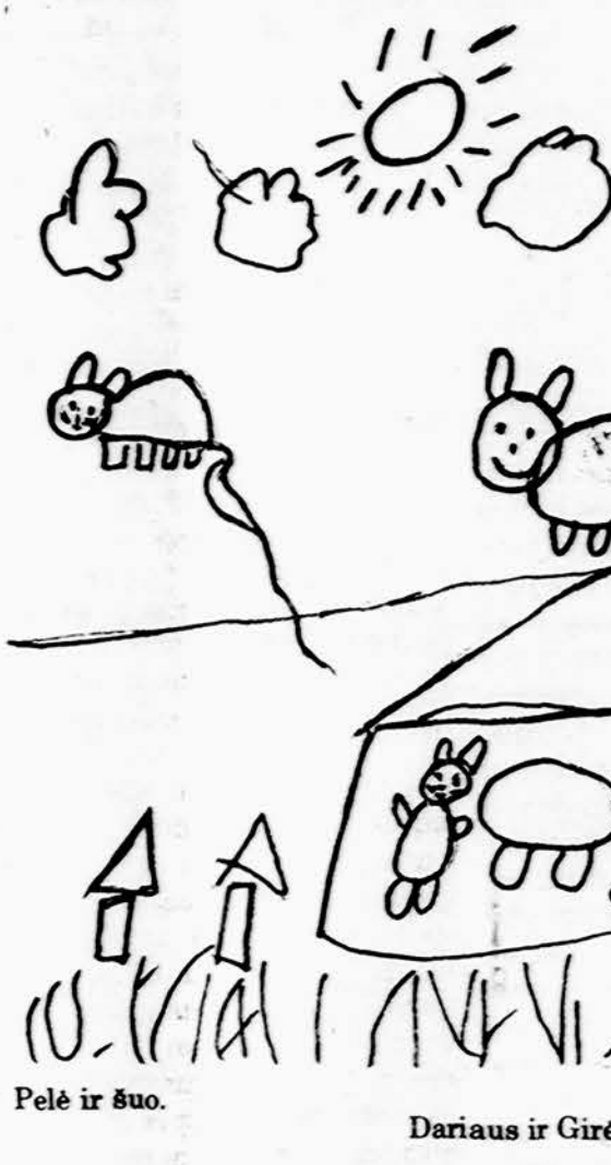
Pelė ir šuo. Dariaus ir Girėno lit. m-los I sk. mokinė

Isteigtas Lietuvių Mokytojų Sąjungos Chicago skyrius