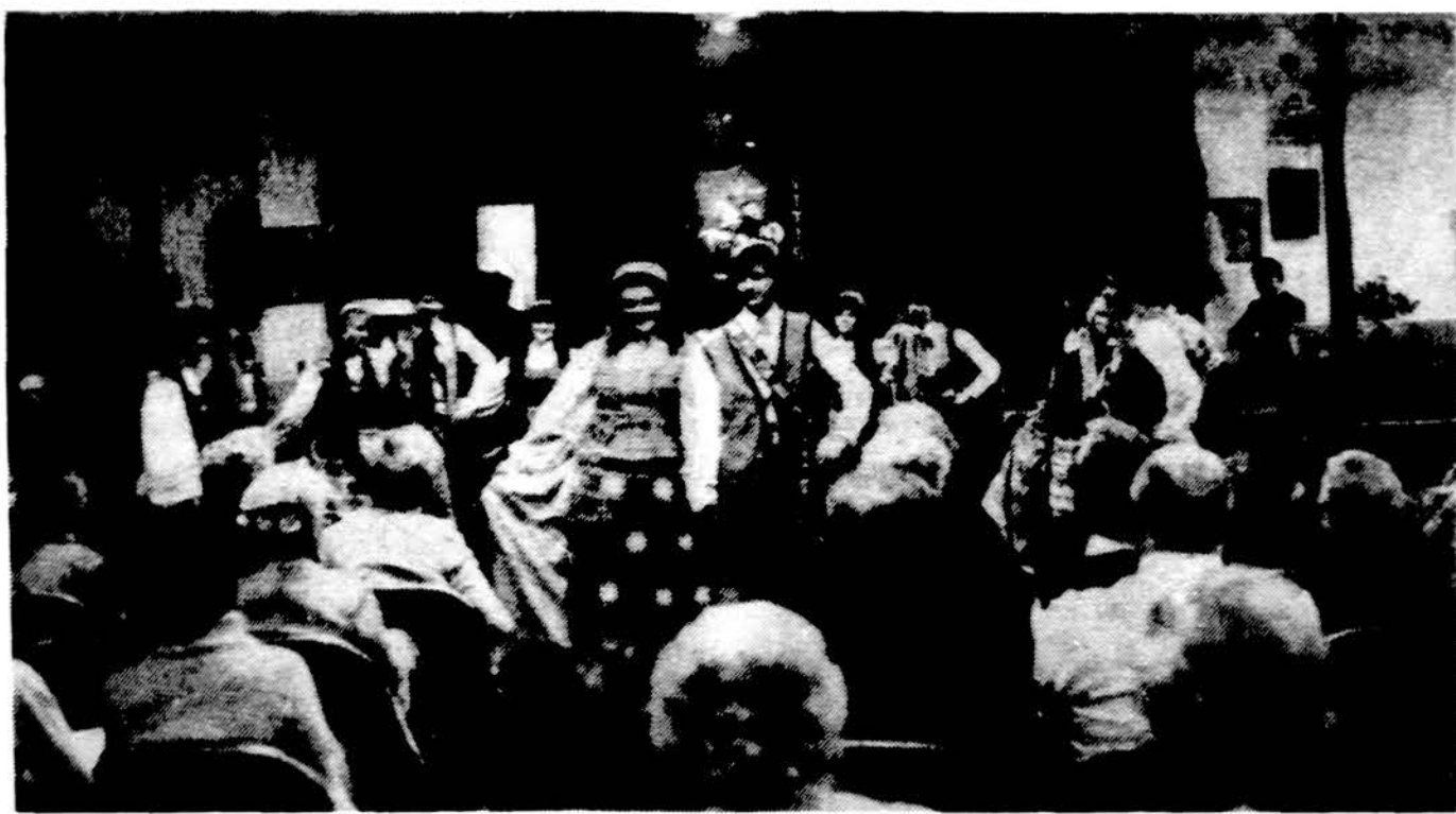
Bostono tautinių šokių šokėjai atlikę programą Athol vyčių surengtame Vasario 16-tosios minėjime.