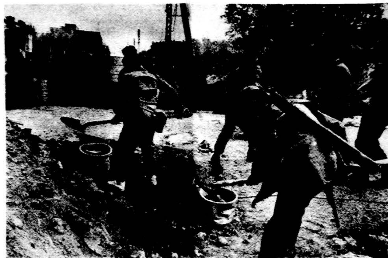
Libano miesto Sidono, kurį neseniai paliko Izraelio kariuomenė, gyventojai stato barikadas. Kilo mušiai tarp krikščionių ir musulmonų. Panaudojama artilerijos pabūklai. Nukentėjo netoli nuo Sidono esanti palestiniečių pabėgėlių stovykla.

Washingtonas. — Sekretorius Shultz pasakė kalbą Spaudos klube apie Amerikos politiką Pietų Afrikos atžvilgiu. Jis pasmerkė aparteidą, tačiau pasmerkė siūlomas ekonomines sankcijas, nes tos sankcijos labai pakenktų P. Afrikos juodiesiems. Demokratai senatoriai: Kennedy ir Weicker siūlo įstatymus, kurie uždraustų bankams skolinti P. Afrikai pinigų, uždraustų pardavinėti Amerikoje aukšines „krugerrando“ monetas, uždraustų pramonės bendrovėms investuoti P. Afrikoje lėšas, uždraustų parduoti P. Afrikai kompiuterius. Sekretorius Shultz pasiskaitė prieš tokias sankcijas. Pietų Afrika įvedanti reformas. Jų daugiau įvesta per paskutinius ketverius metus, negu per praėjusių 30 metų, pasakė Shultz. Sankcijos daugiausia