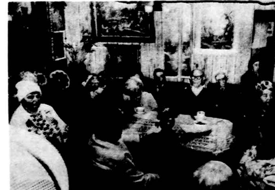
Dalis atsilankiusių į Alvdvo pažmonį Lietuvos sodyboje klausosi sveikatos patarimų.