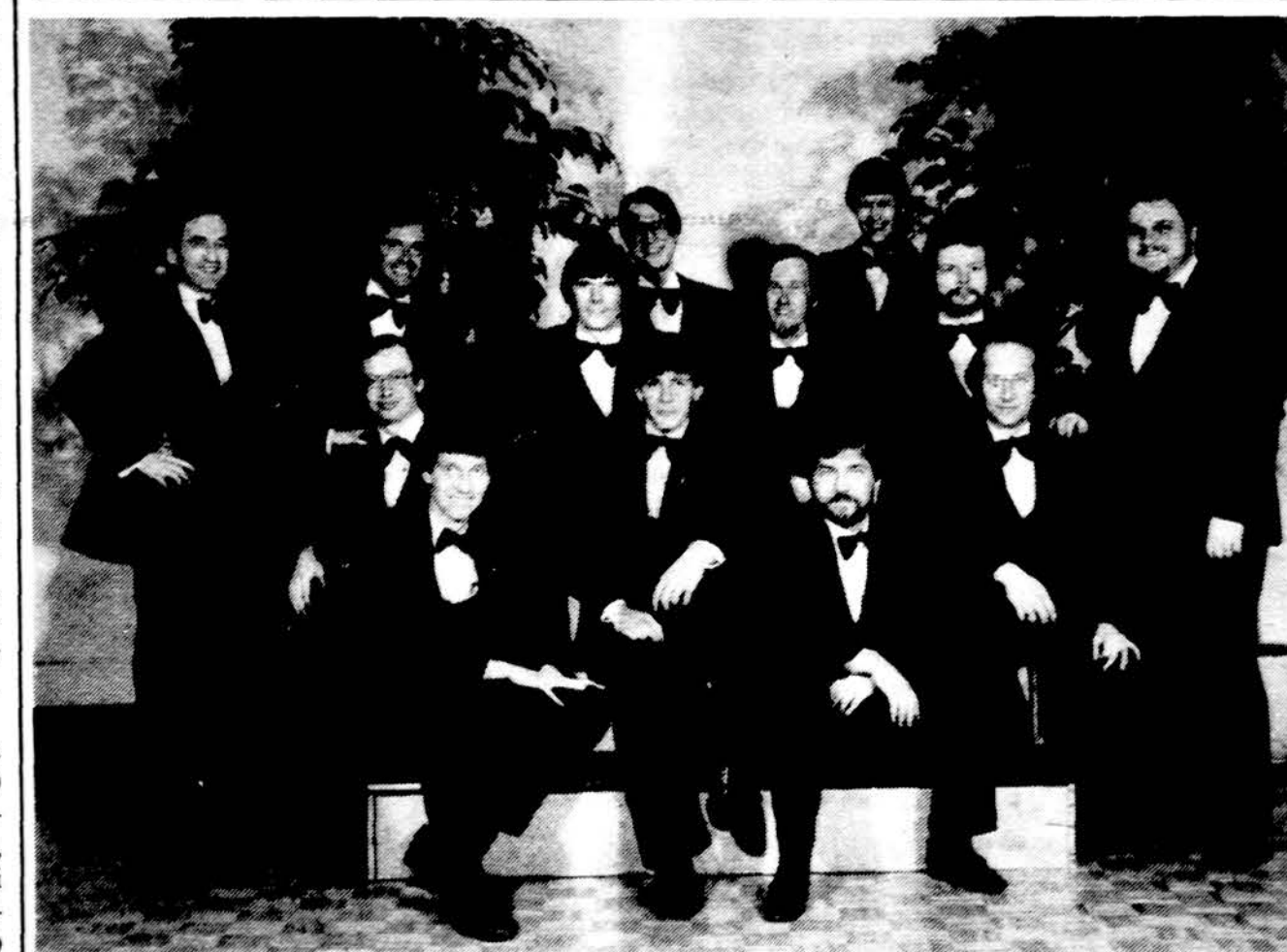
„Volungės“ choro vyrai, kurie atliks koncertą gegužės 18 d. Marijos aukšt. mokyklos saleje, minint „Draugo“ 75-rių metų jubiliejų.