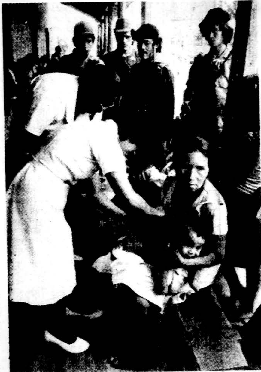
Sekmdienį Salvadore buvo karo paliaubos, kad medicinos darbuotojai, Jungtinių Tautų vaikų fondai ir katalikų vyskupams organizuojant galėtų netrukdomi paskiepyti 250,000 vaikų. Nuotraukoje skiepijimą stebi Salvadoro revoliucionieriai sukilėliai. Šalyje veikė 2,000 skiepijimo punktų, kur iki 5 metų amžiaus vaikai gavo skiepus nuo difterito, kokliušo, polio, vėjaraupio.

Pietų Korėjoje gatvėse demonstravo studentai, reikalaujami demokratinį rinkimų.