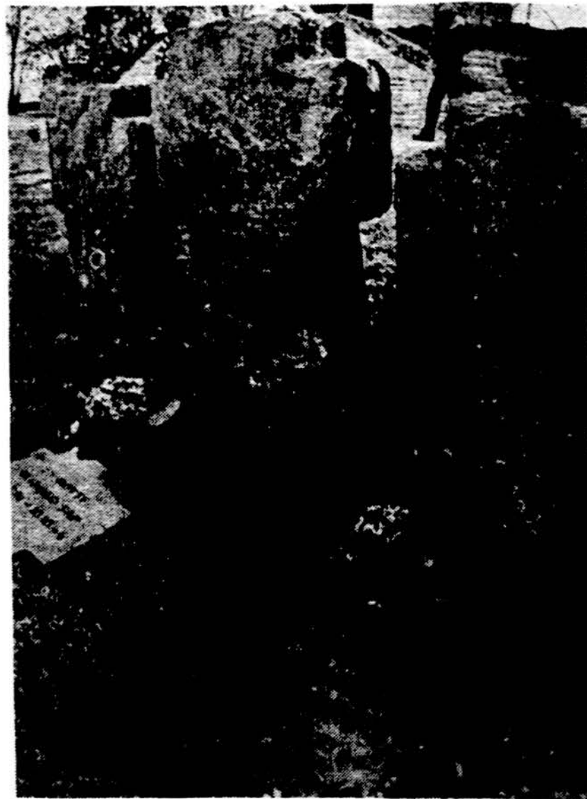
Sekmadienį prezidentas Reaganas planuoja aplankyti V. Vokietijos karių kapines Bitburge. Šis vizitas sukėlė didelių Amerikos žydų priekaištus. Nuotraukoje matomi dviejų „Waffen-SS“ karių kapiai.

Tarptautinis valiutos fondas pritarė 300 mil. dol. paskolai Jugoslavijos vyriausybei. — Dvi bombos sužalojo pastatus Pietų Afrikos dviejuose aukso kasyklose. Jos buvo atleisusios iš darbo tūkstančius juodųjų darbininkų, kurie dalyvavo nelegaliame streike.