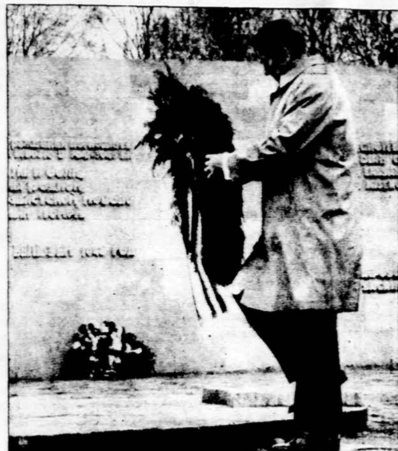
Prezidentas Reaganas padeda vainiką prie paminklo žuvusiems Bergen-Belsen koncentracijos stovykloje, Vakarų Vokietijoje.

New Yorkas. — Tūkstančiai žmonių New Yorke sekmadienį demonstravo, išreikdami savo paramą sovietų žydams. Tai buvo jau 14-toji metinė New Yorko manifestacija, ginanti sovietų žydų teises emigruoti. Šiais metais demonstracijos kalbėtojai, ju tarpe meras Koch, gubernatorius Como, arkivyskupas O'Connor, senatoriai D'Amato ir Moynihan pasinaudojo proga kritikuoti prezidento Reagano vizitą Bitburgo vokiečių kareivių kapinėse. Meras Koch pasakė, kad tas vizitas yra demė istorijai ir prezidento atliktoms darbams. — Nežinomi Peru piktadariai nušovė amerikietį baptyvistą misijonierį. — Irakas paskelbė, jog Peresų įlankoje vėl sužaloti du dideli prekybos laivai.