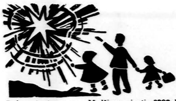
Redaguoja J. Piacas. Medžiagą siūsti: 3206 W. 65th Place, Chicago, IL 60629

x Grafika — Tapyba — Akvarelė. Meno paroda ir paveikslų išpardavimas. Čiurlionio Galerijai sutelkti lėšų. Ten bus galima įsigyti lietuvių dailininkų darbus labai prieinamom kainomis ir tuo pačiu paremti Čiurlionio galerijos vadovybės pastangas sutelkti lėšas galerijos pagerinimui. Galerijos pagerinimui yra numatyta jau naujai perdažyti, įsigyti daugiau šviesų, išvalyti lubose esančią apšvietimo sistemą ir t. t. Atidarymas gegužės 17 d., 7:30 v. v. Paroda tęsis iki gegužės 26 d. Lankymo valandos penktadienį 7 — 9 v. v. Šeštadienį ir sekmadienį 11 — 7 v. v. Čiurlionio galerijai maloniai visus kviečia pasinaudoti šia proga.