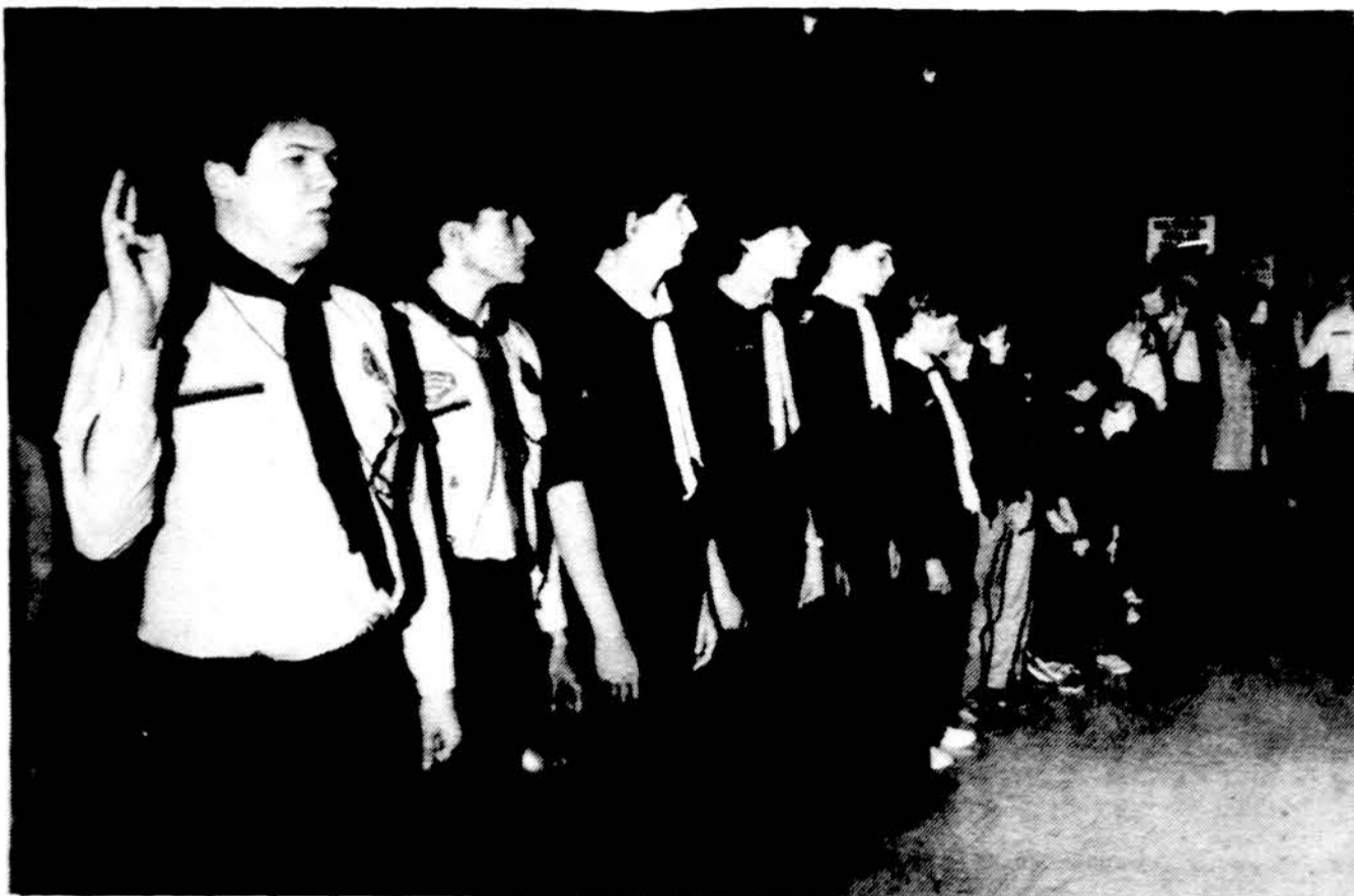
Dalis brolių Montreolio Kaziuکو mugės atidaryme.

Prityrusių ir jūrų skautų,čių Skautiškų susitiktuvių paruošos darbai jau baigti, paliekant tik „taškų su-