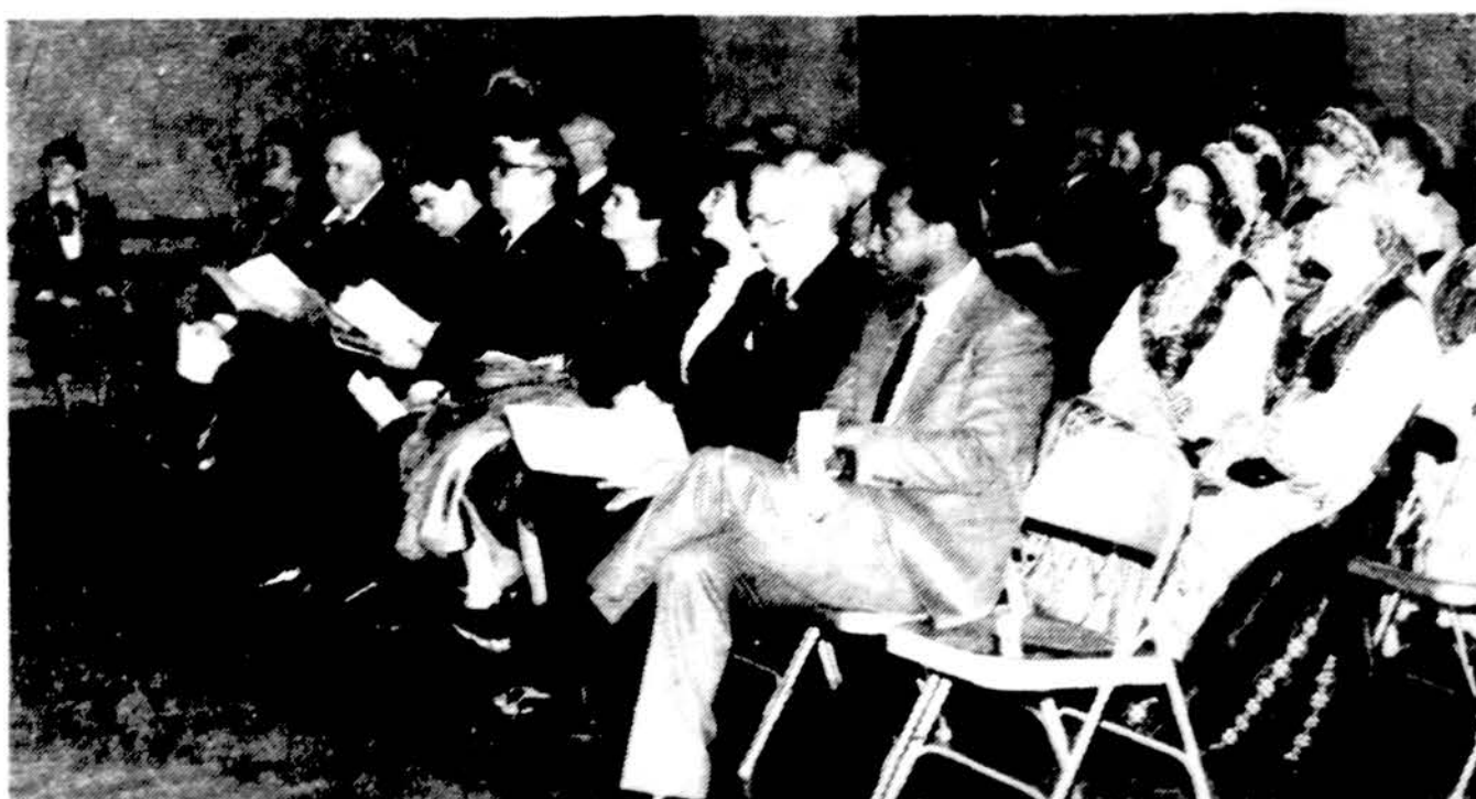
Philadelphijos meras W. Goode tarp lietuvių (pirmoj eilėj pirmas iš dešinės). Nuotrauka dar iš Vasario 16 minėjimo. Neseniai meras Goode turėjo daug nemalonumų su radikaliu lizdu, kai naujų metų buvo 11 žmonių ir sudėgė 60 namų.

III. gyv. prideda 5% valstijos mokestių.