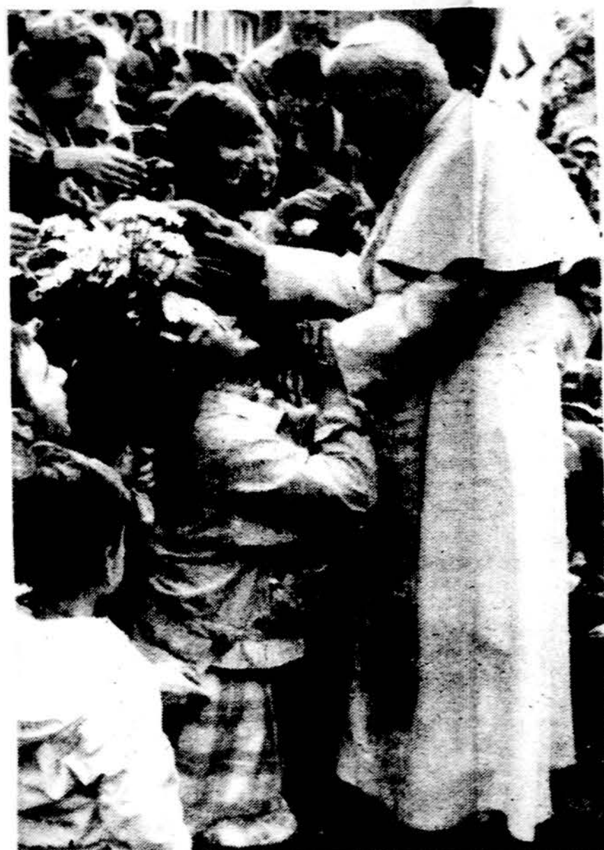
Popiežius Jonas Paulius II baigė savo vizitą Belgijoje. Nuotraukoje tikintieji jį sutinka Briuselyje prie Švč. Marijos bažnyčios.