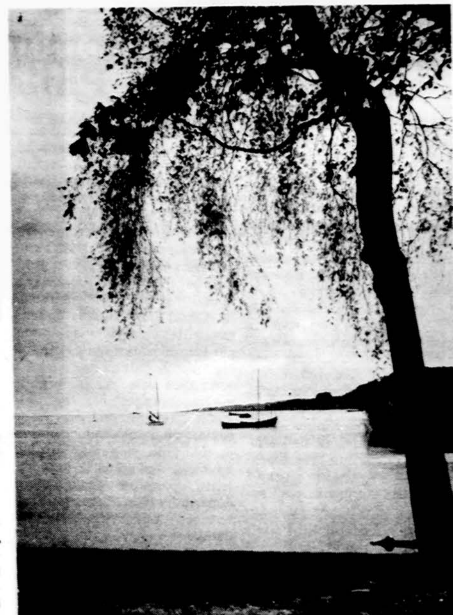
Kuršių marios. Prieškarinė nuotrauka

Stiprus, beveik nenugalimas tautų veržimasis į išsilaisvinimą yra vienas iš pagrindinių laiko tyrinėtų, kurį Bažnyčia turi tyrinėti ir aiškinti Evangelijos šviesoje. Toks veržimasis išreiškia tikrą, nors dar neapibrėžtą, žmogaus orumo nuovoką, žmogaus, kuris yra sukurtas „pagal