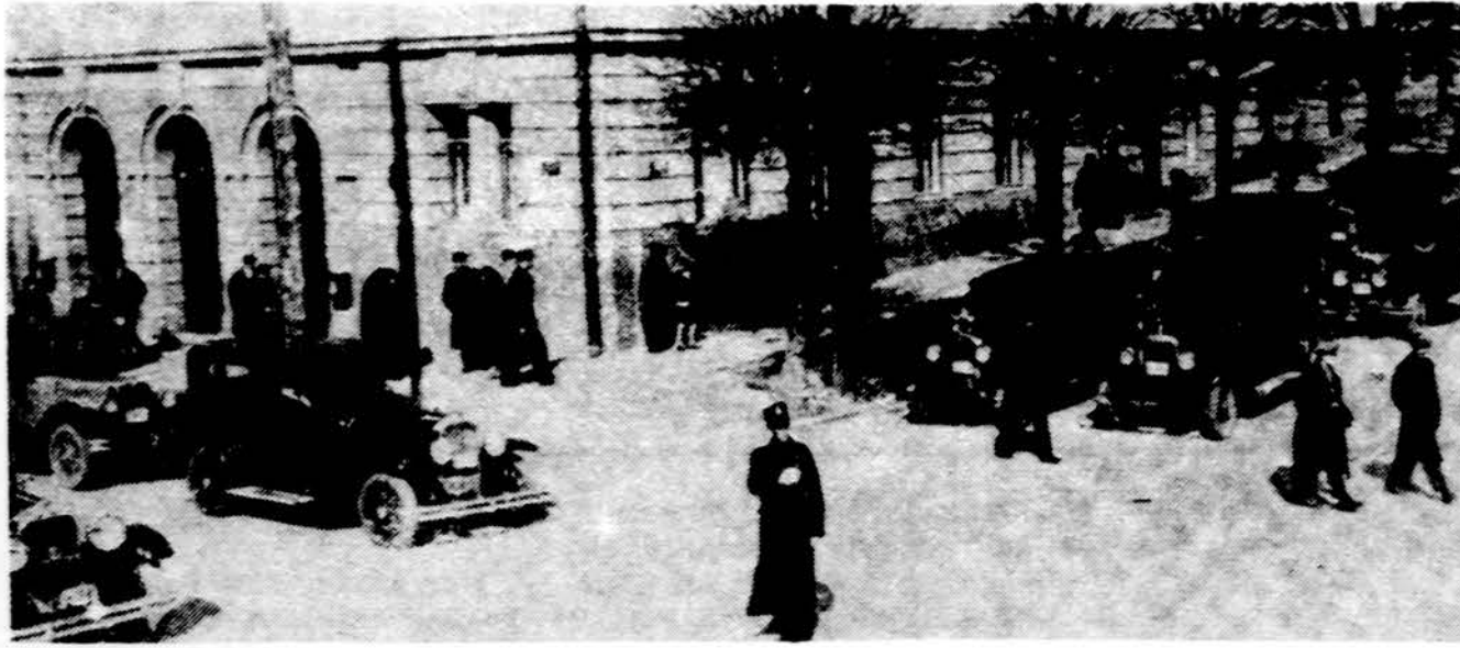
Kaunas 1930 metais. Automobilų anais laikais jau buvo nemažai ir mūsų laikinojo sostinė.