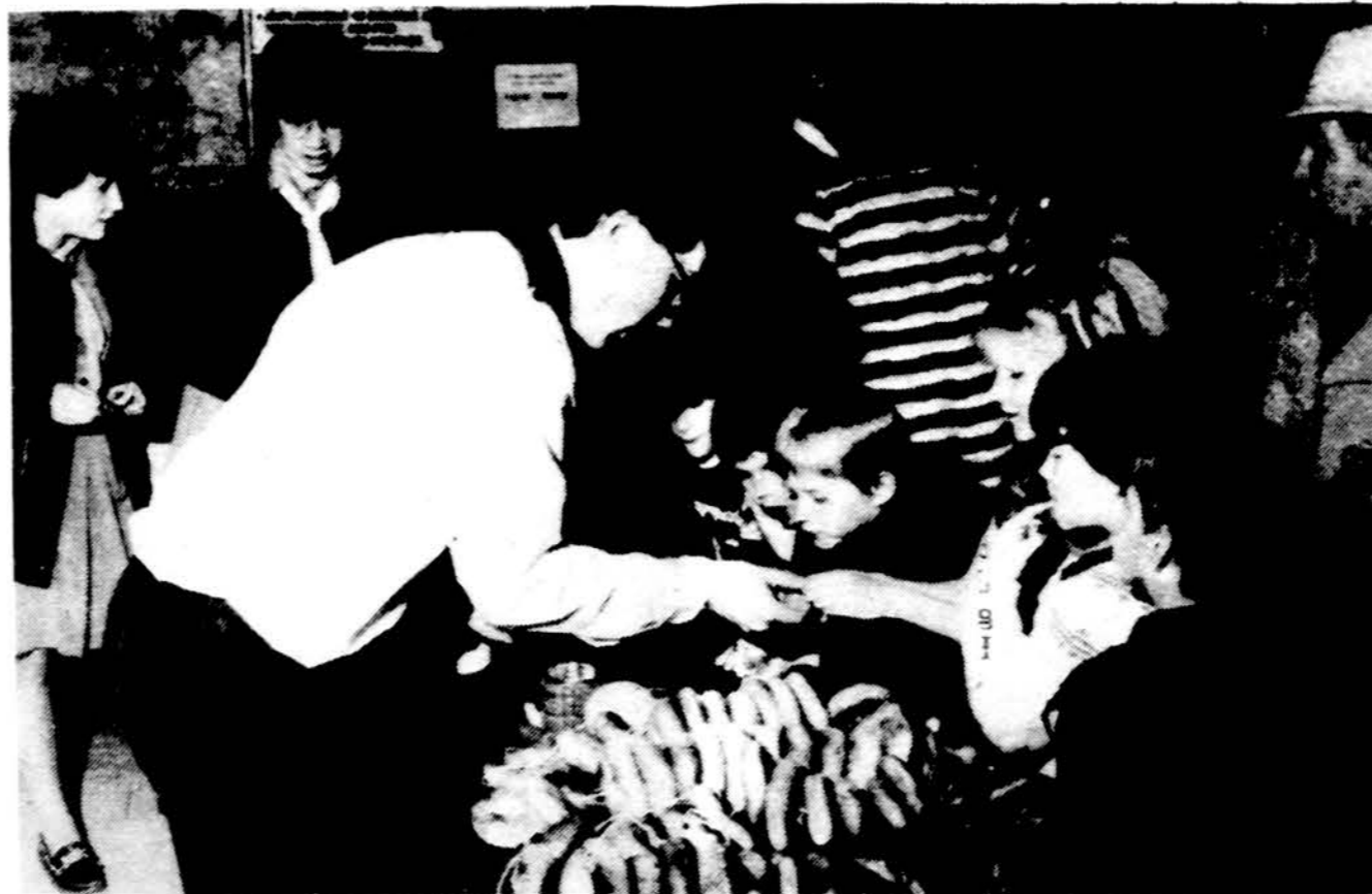
Gyva prekyba vyksta Montrealio skautų ir skaučių Kaziuko mugėje.