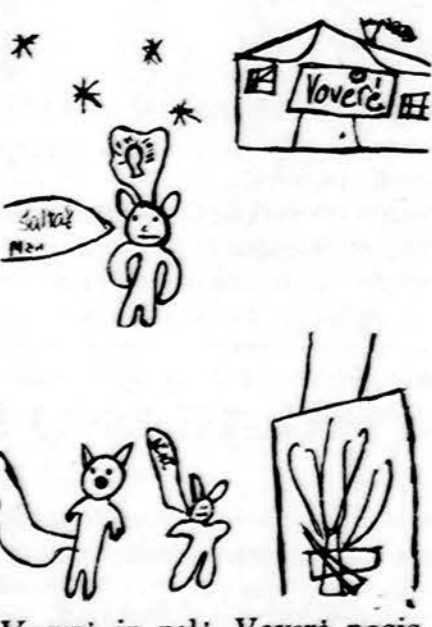
Voverė ir pelė. Voverė pasistatė namelį, o pelė tingėjo. Piešė Leila Saib, Dariaus Girėno lit. m-los mokinė.

Kadangi jis neturėjo dolerio monetos ir penkių centų monetos (nes negalėjo iškeisti 15 c.), tai pas jį buvo 50 centų, 25 centai ir keturi dešimtukai.