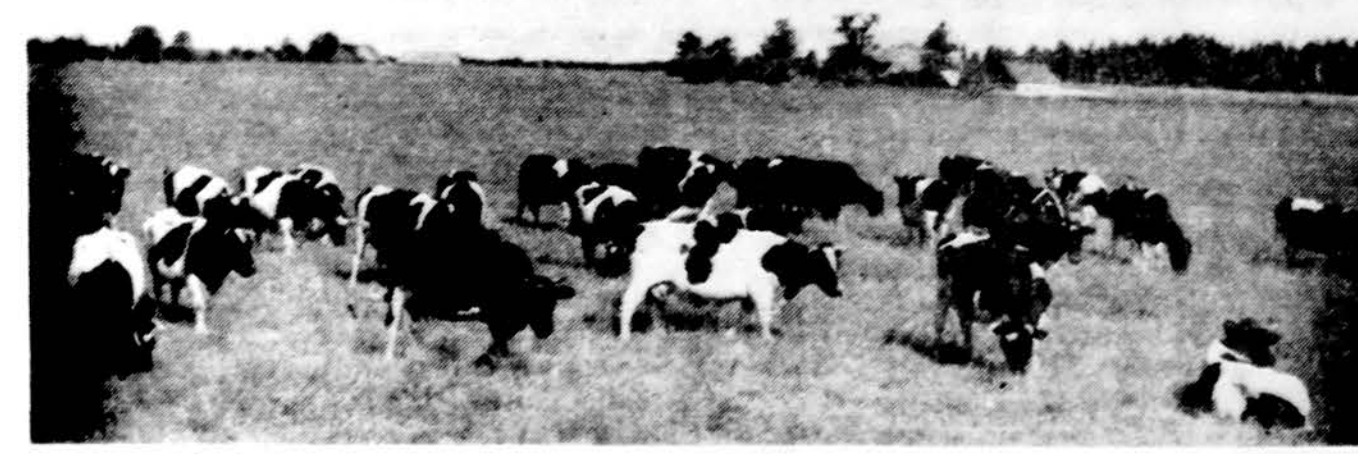
Pasiturinčio lietuvių ūkininko juodmargės nepriklausomybės laikais