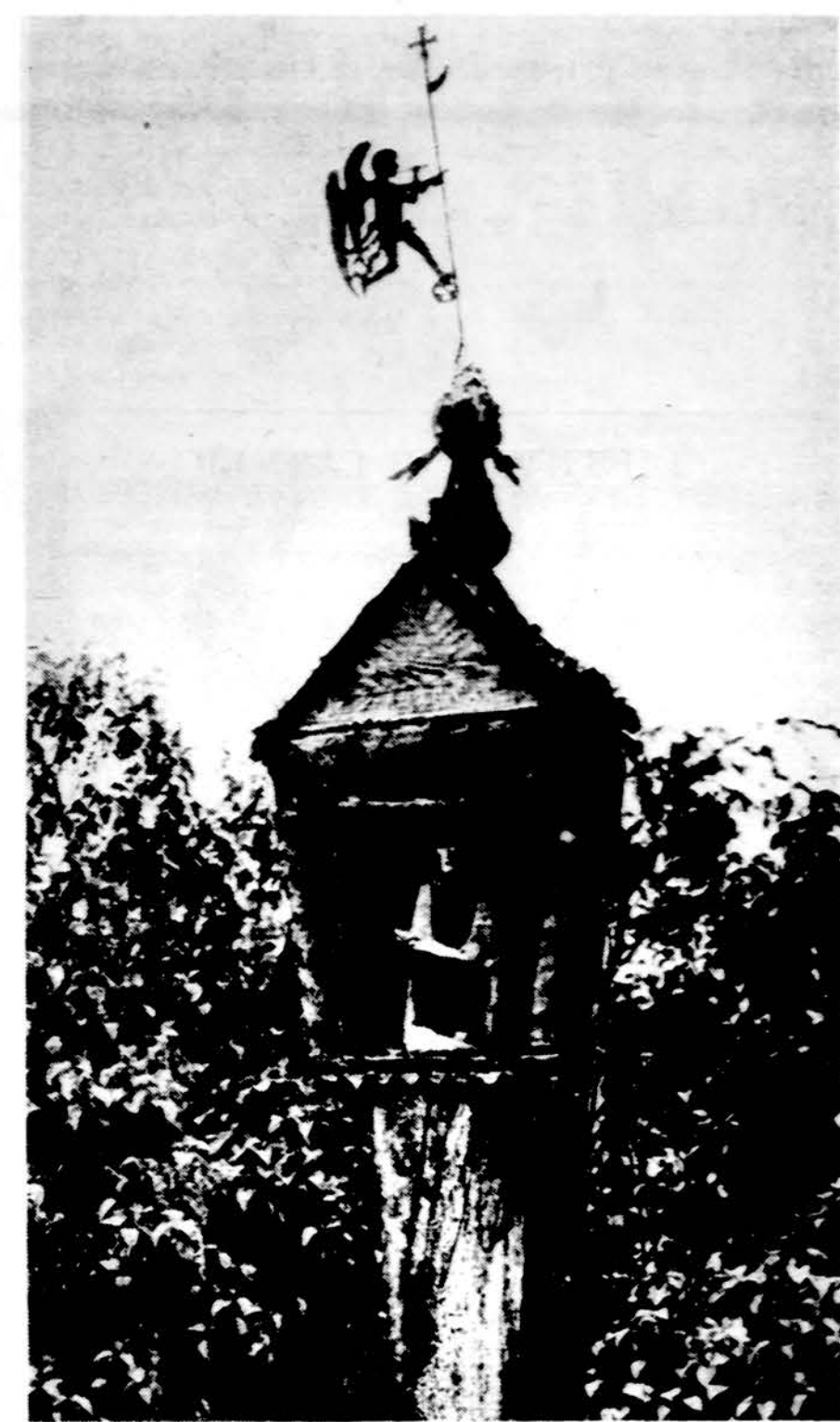
Zemaičio kopytelė. Petraičio km., Mazeikių aps.