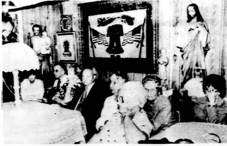
Lietuvio sodyboje Alvudo surengtame pažmonyje pensininkai klausosi sveikatos patarimų.

Ligoms atsparumo įgytas bravykimas (AIDS) anksčiau buvęs pederastų tarpe ir Trečiojo Pasaulio kraštuose, dabar išsiplėtė visuomenėje ir