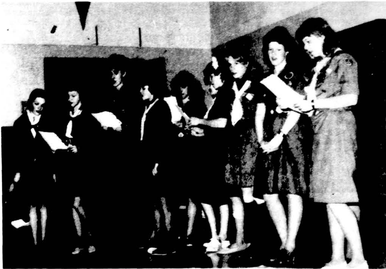
Dainuoja „Satrijos“ draugovės sesės.

GYDYTOJAS IR CHIRURGAS 6745 West 63rd Street Val. pirm., antr. ketv. ir penkt. 3-6; šeštadieniais pagal susitarimą