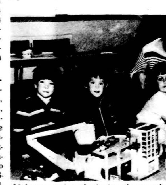
Malonu žaisti ir mokytis rūpestingos mokytojos globoje.

Neseniai aš pasiėmiau sausio mėn. 10 d. „Draugą“ ir pradėjau skaityti vieną straipsnį, kuris man atrodė būtų vienas iš įdomesnių. Bet aš nusivyliau, nes man buvo nuobodus. Žinau, kad aš nesu vientelė šio jaunimo, kuris galvoja, kad lietuviška spauda yra nuobodi. Kai pradėjau skaityti, pirmiausia pastebėjau, kad yra daug nežinomų žodžių. Reikėjo naudoti žodyną. Ieškant žodžių pasvarstytį ir pasidaro neįdomu skaityti. Galvoju, kad ta tema neįdomi ir todėl pabandžiau skaityti kitą straipsnį. Vėl buvo tos pačios problemos.