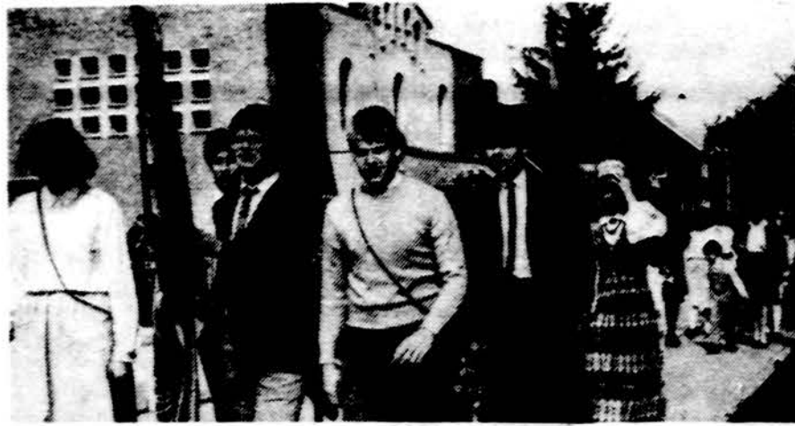
Pavasario šventę švėsdami Clevelando ateitininkai žygiuoja į bažnyčią.