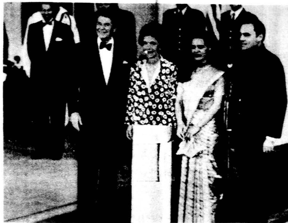
Baltuosiuose Rūmuose iškilmingai priimti užsienio svečiai. Šalia prezidento Reagano ir ponios Nancy Reagan stovi Sonia Gandhi, buvusi Sonia Maino, italų kilmės Indijos premjero Gandhi žmona. Prie jos – premjeras Rajiv Gandhi. Šiam banketui maistas, virėjai ir net indai buvo atvežti iš Indijos. Po valgio buvo Indijos šokių ir muzikos koncertas.