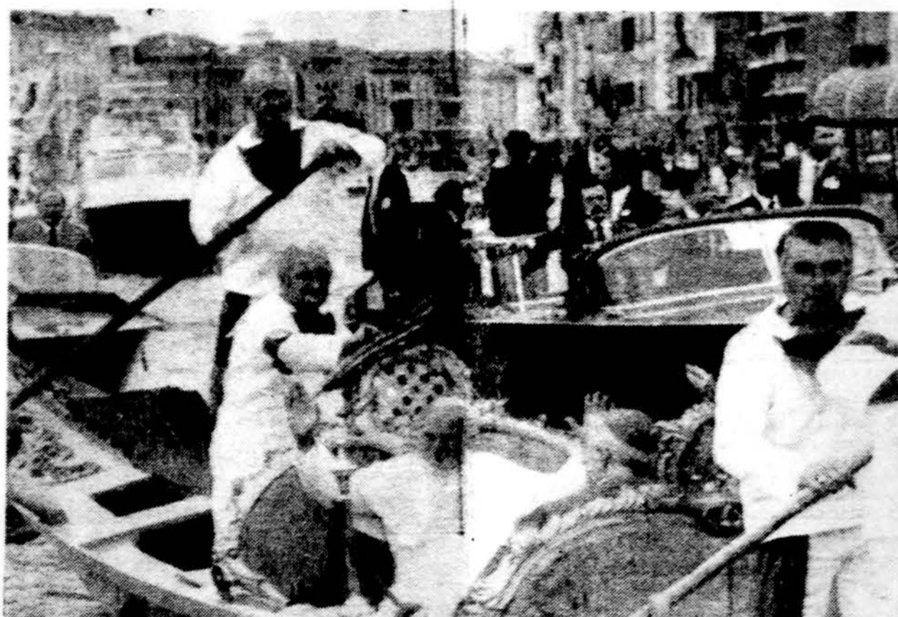
Popiežius Jonas Paulius II lanko šiaurės rytų Italiją. Venecijon jis atplaukė, lydimas šimtų laivelų, garsia „La Dogressa“ gondola. Treviso mieste popiežius išėjo seseris vienuolės neperimti vidurinėsios klasės papročių ir nesivaikyti modernišku.

— Brazilijoje žemkasiai vėl atkasė Mengeles (vadinamo Gerhardo) kapą ir vėl kažko ieškojo. Iš kapo paimti keli maišai grumstų ir kitų objektų.