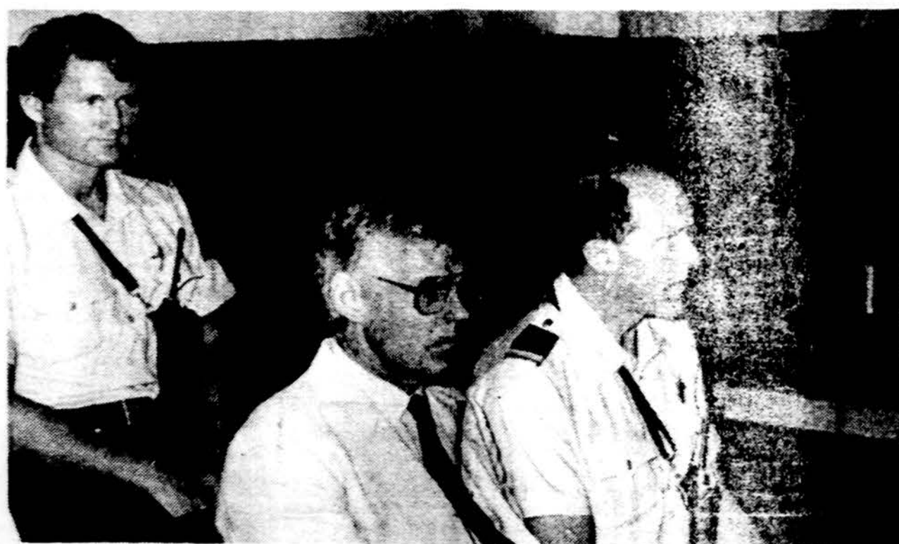
Aukštas Norvegijos diplomatas Arne Treholt buvo nubaustas už šnipinėjimą sovietams 20 metų kalėjimo.

Pirmas popiežius aplankęs šį kraštą buvo Paulius VI 1964-ais metais Bombėje dalyvavęs Tarptautiniame Eucharistiniame kongrese. Katalikai Indijoje tesudaro 1,6 procento gyventojų, kurių iš viso yra 730 milijonų.