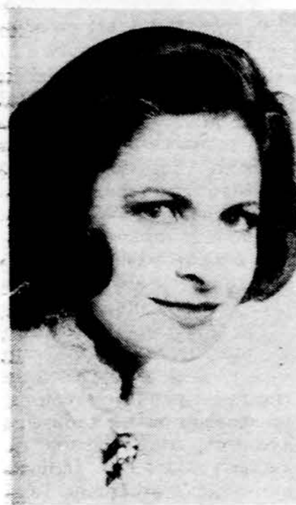
Nijolė Voketaitienė

Nenorėdama aiškintis, kad nemananti modeliuoti, ji, kaip ir kitos užpildė anketą ir buvo toji, kuri laimėjo.