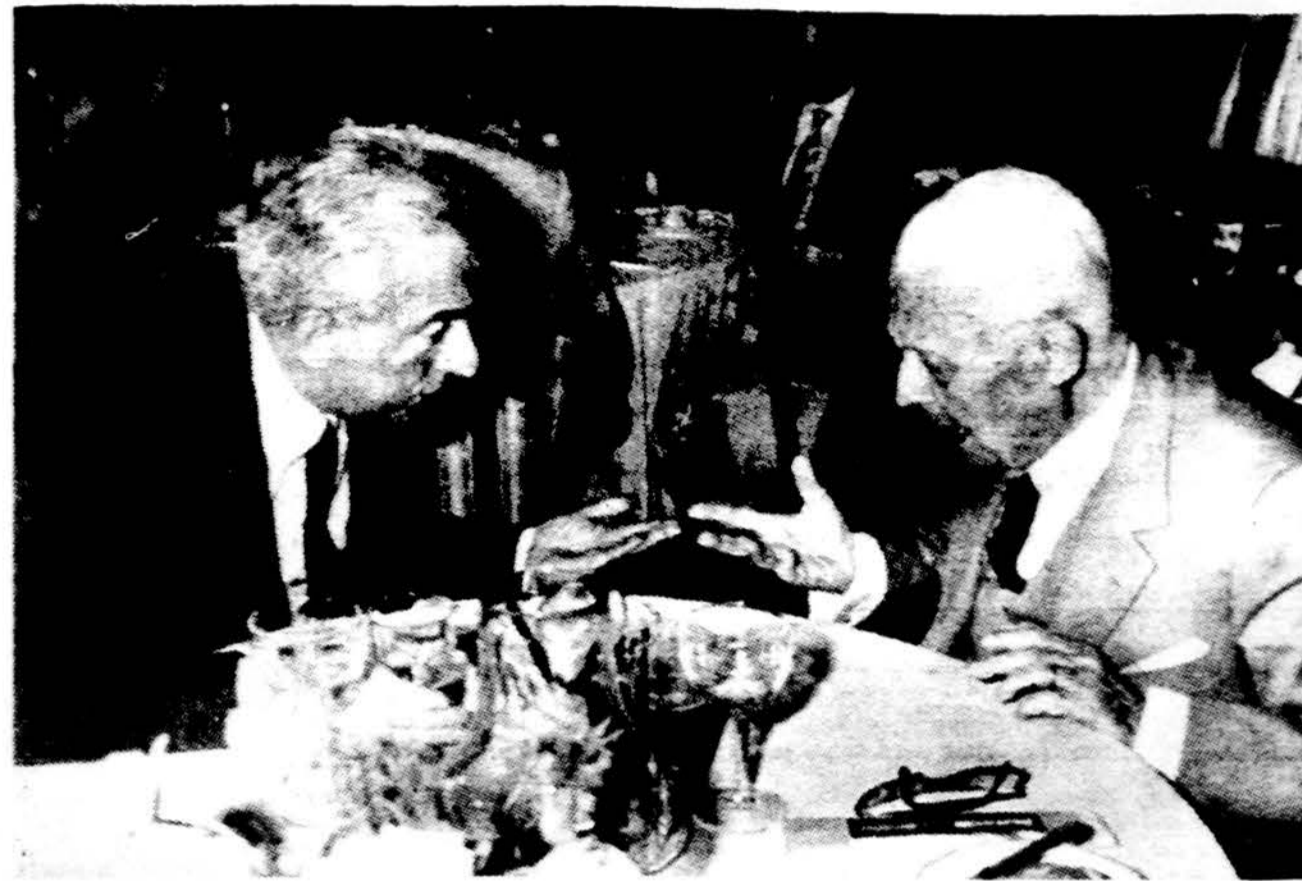
Du Italijos prezidentai tariasi po rinkimų. Dešinėje dabartinis prezidentas Sandro Pertini, socialistas. Kairėje naujai išrinktas Italijos prezidentas, krikščionis demokratas Francesco Cossiga, kuris pareigas perims liepos 8 d.

Už Cossigą balsavo 752 elektoriai, iš 977 balsavusių. Jį parėmė ir nemažai komunistų. Tik naujoji fašistų partija už prezidentą nebalsojo. Elektorių kolegijai pirmininkavo, kaip senato pirmininkas, išrinktasis Cossiga kartu su žemųjų rūmų pirmi-