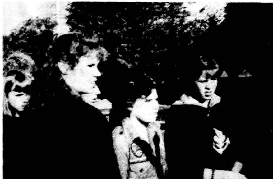
Skautiškosose Susitiktuvėse Dainavoje sesės renkasi vėliavos pakeliumi.