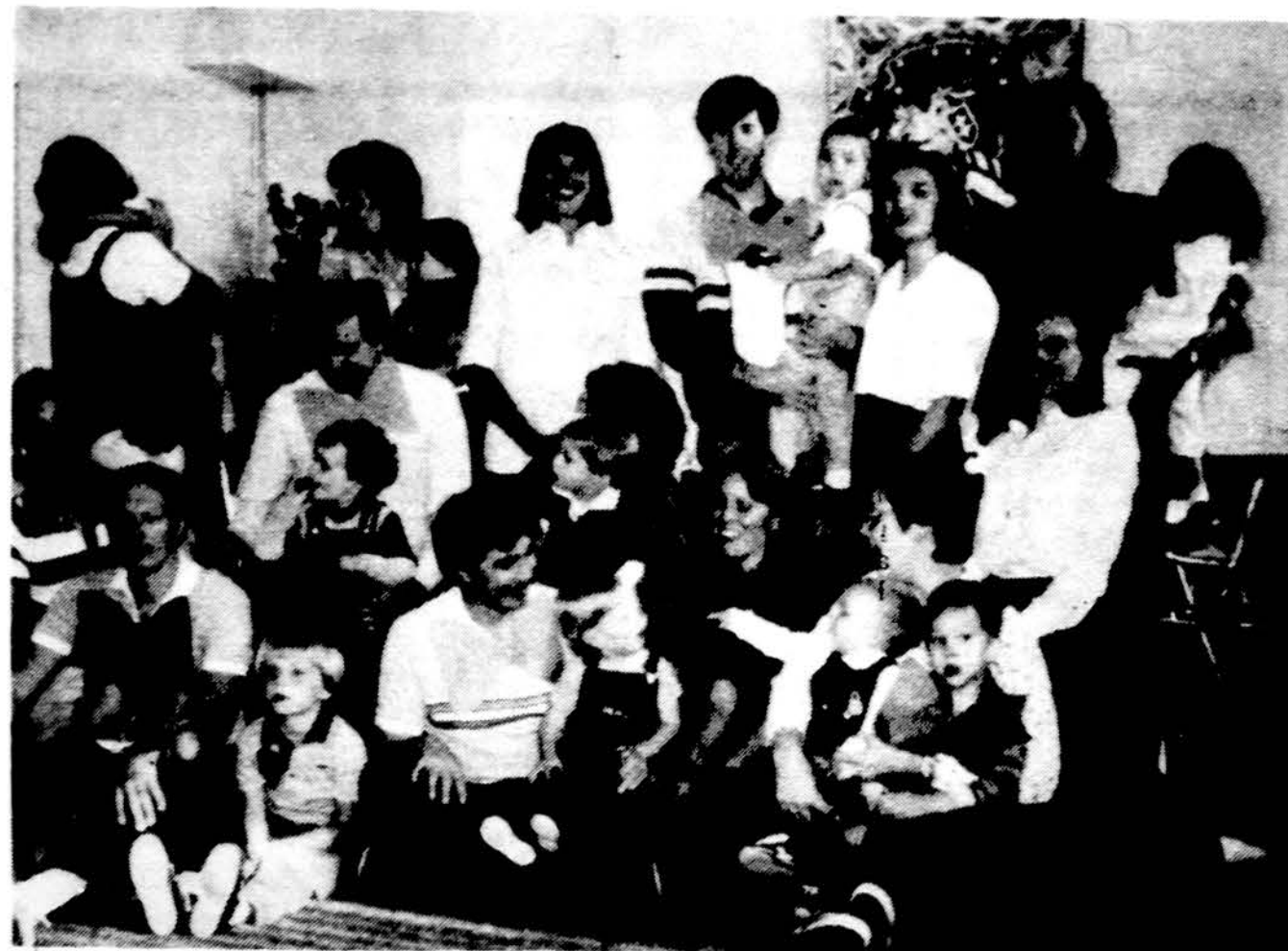
„Seimos portretas“ — baigiant liepsnelių ir giliukų sueigą nusifotografuojama su marnytėmis ir tėveliais.