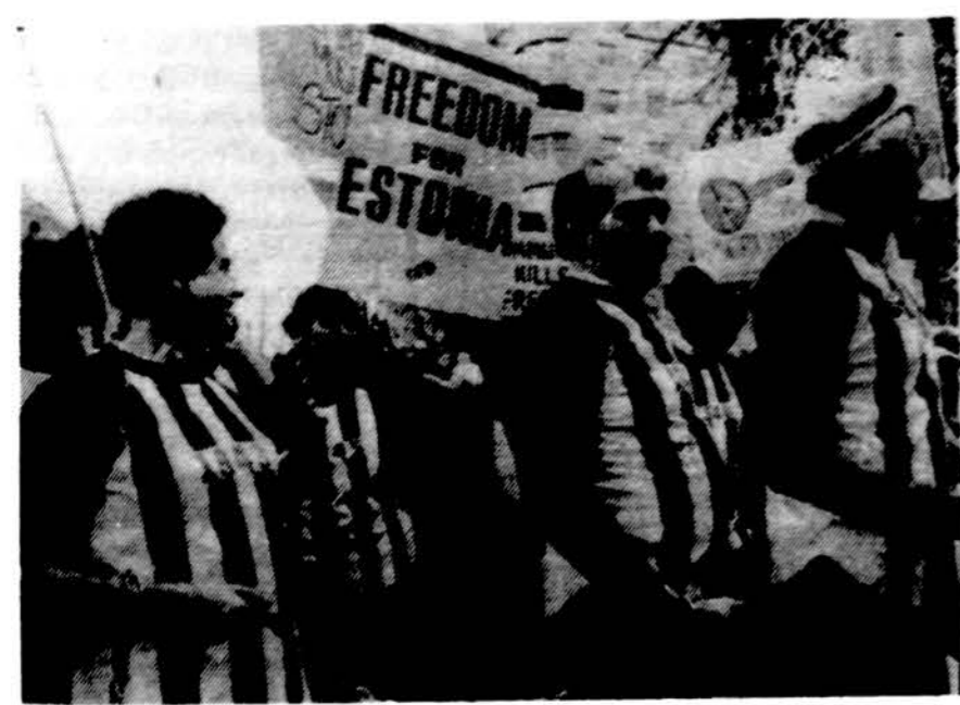
Birželio išvežimų ir Sovietų Sąjungos okupacijų sukaktuvėse pavergtų tautų atstovai demonstruoja Washingtone, D.C.