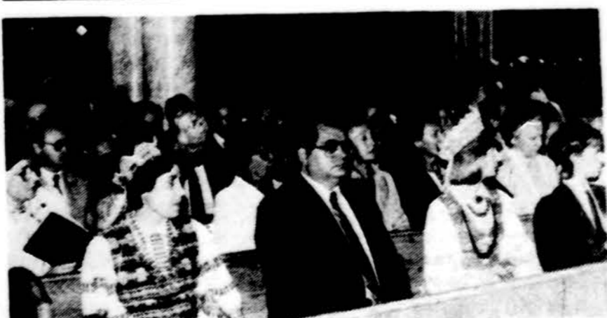
Clevelando ateitininkų metinės šventės dalyviai Dievo Motinos šventėje.