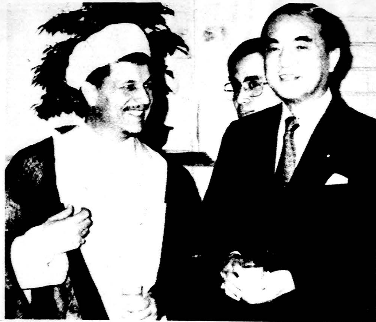
Penkis dienas Japonijoje viešėjo Irano parlamento pirmininkas Hashemi Rafsanjani (kairėje). Japonų žinių agentūra pabrėžia, kad stiklai, kurie nuotraukoje matomi Rafsanjani ir Japonijos premjero Jasushiro Nakasone rankose, buvo vasių sunkos taurės. Islamo fundamentalistų valdomame Irane alkoholi vartoti griežtai draudžiama.