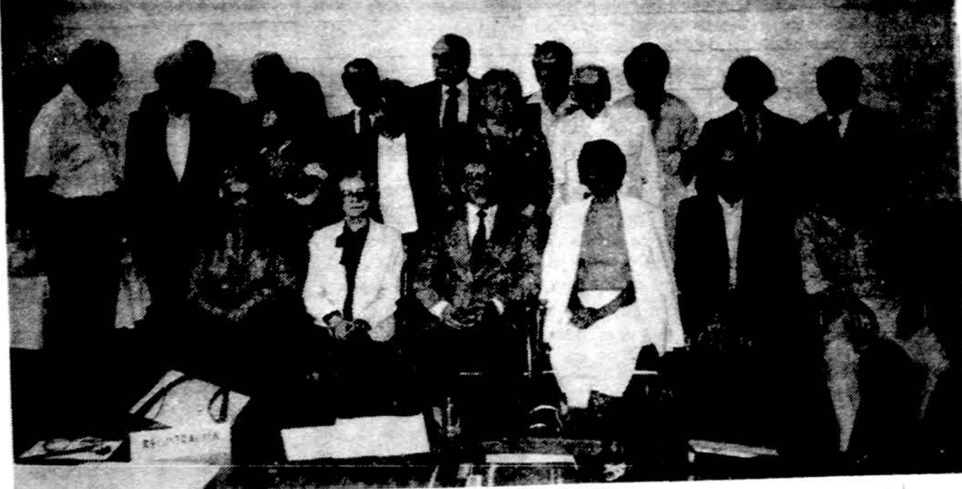
Amerikos Lietuvių Bibliotekos leidyklos vadovybė ir nariai metiniame susirinkime Chicagoje birželio 16 d. (apr. buvo „Draugo“ liepos 5 d. laidose)