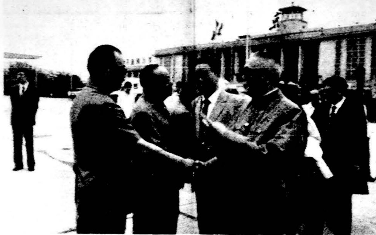
Kinijos premjeras Zhao Ziyang (kairėje) atsisveikina su Kinijos prezidentu Li Xiannian Pekino aerodrome. Prezidentas Li jau atvyko į Kanadą, kur viešės 10 dienų. Po to 76 metų prezidentas liepos 22 d. atvyks į Niagara Falls, kur pradės savaitės vizitą JAV-se. Žalia vizito Washington, kur jis tarsis su prezidentu Reaganu, Kinijos prezidentas aplankys Los Angeles, Chicago, ir Honolulu.