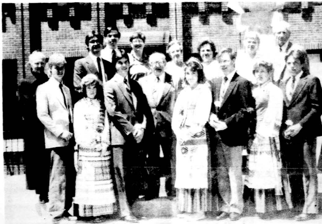
Chicagos Aukštesniosios lietuvištosios mokyklos trisdešimt ketvirtoji laida su mokytojais ir mokyklos rėmėjais.

x Baltic Monuments, Inc., 2621 W. 71 Street, Chicago, Ill. Tel. 476-2882. Visų rūšių paminklai, žemiausios kainos, geriausiomis sąlygomis. (sk.)