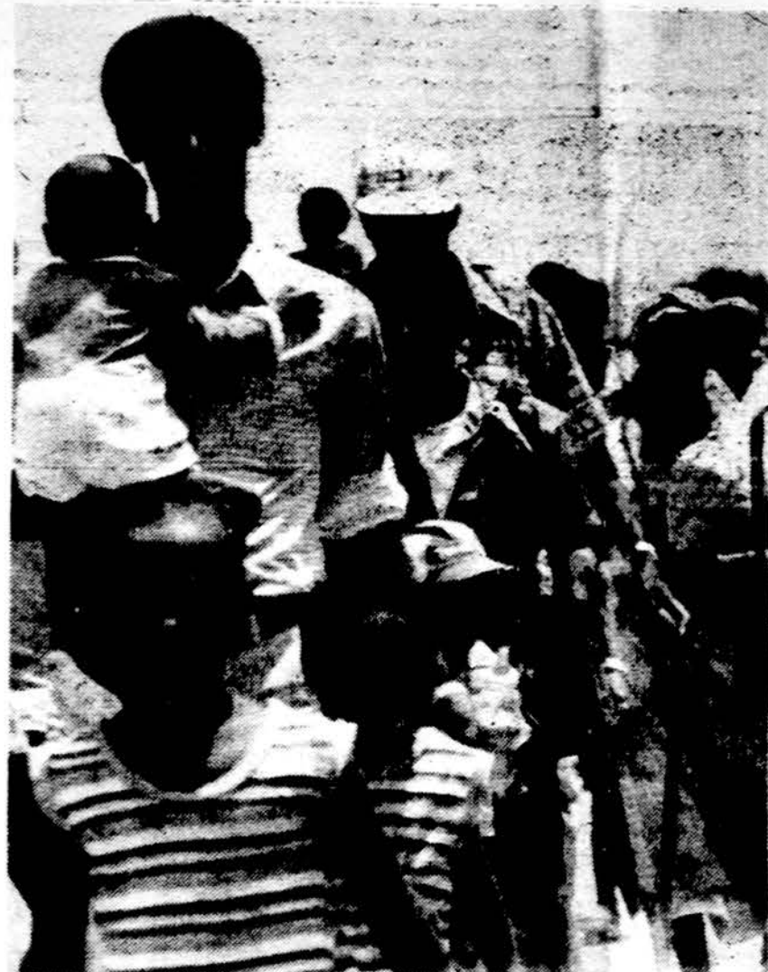
Juodieji žydai Izraelyje protestuoja dėl rabinų reikalavimo, kad jie atliktų kai kurias apeigas, prieš gaudami „tikrųjų žydų“ dokumentus. Iš Etiopijos atgabenti falašai žygiavo į Tel Avivo aerodromą, reikalaudami, kad juos vežtų atgal į Sudaną, iš kur jie buvo perkelti į Izraelį. Protesto žygis buvo nutrauktas, kai premjeras sutiko susitikti su falašų vadais ir išklausti jų skundų.

Velionis buvo gimęs 1907 m. rugšėjo 5 d. Diržų km., Žemelio valsč., Šiaulių apskr. 1925 m. baigė Linkuvos gimnaziją, o 1930 m. Žemės ūkio akademiją Dotnuvoje, gaudamas agronomo diplomą. Dar studijavo Goettinge Vokietijoje ir McGill universitete Montrealyje, Kanadoje,