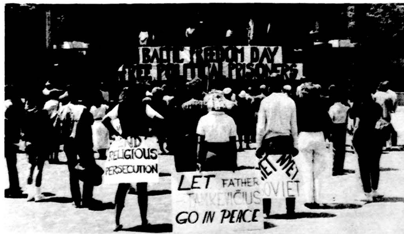
Birželio 14 d. Detroito miesto centre pabaltiečių jaunimo buvo suorganizuota Baltų Laisvės diena.