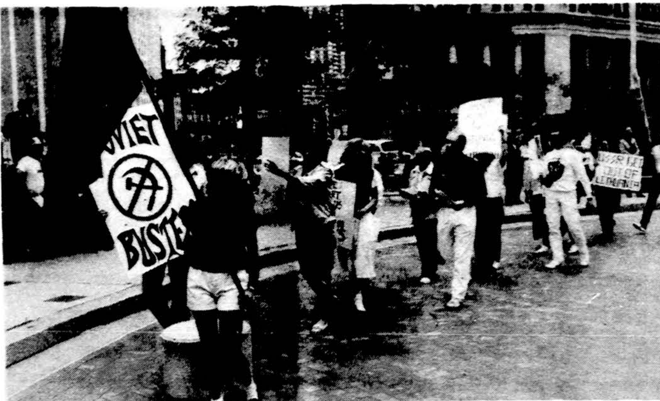
Pabaltiečių demonstracijos Detroite.

Detroito Lietuvos Dukterys, sekmadienį, rugpjūčio 18 d., ruošia gegužinę gražioje