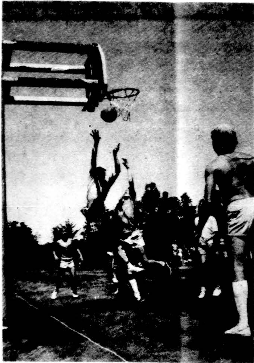
Krepšinio rungtynės moksleivių ateitininkų stovykloje Dainavoje.

Džiugu, kad lietuvių jaunimo organizacijos, pagal galimybes skatina jaunimo domėjimąsi ir dalyvavimą sporte.