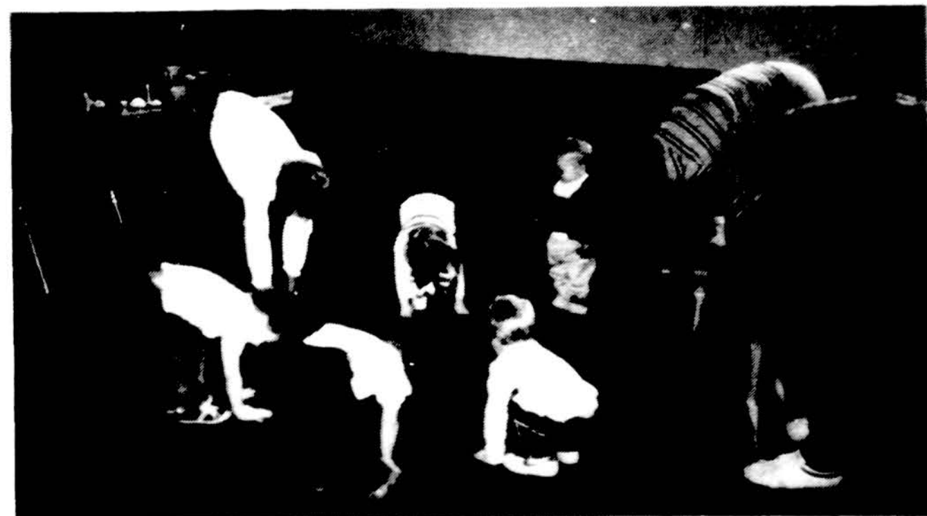
Būsimeji Salfass nariai — jauniausieji Chicago skautukai — liepsnelės ir giliukai sueigas pradeda gimnastikos pratimus. I pratimus jungiasi ir tėveliai.

Turnyro registracija bus vykdoma penktadienį, rugpj. 30 d., 7 val. vak. Hollyday Inn viešbutyje, St. Joseph, MI. Varžybos (ruggj. 31 ir rugsėjo 1 d.) prasidės 8 val. ryto — Michigano laiku.