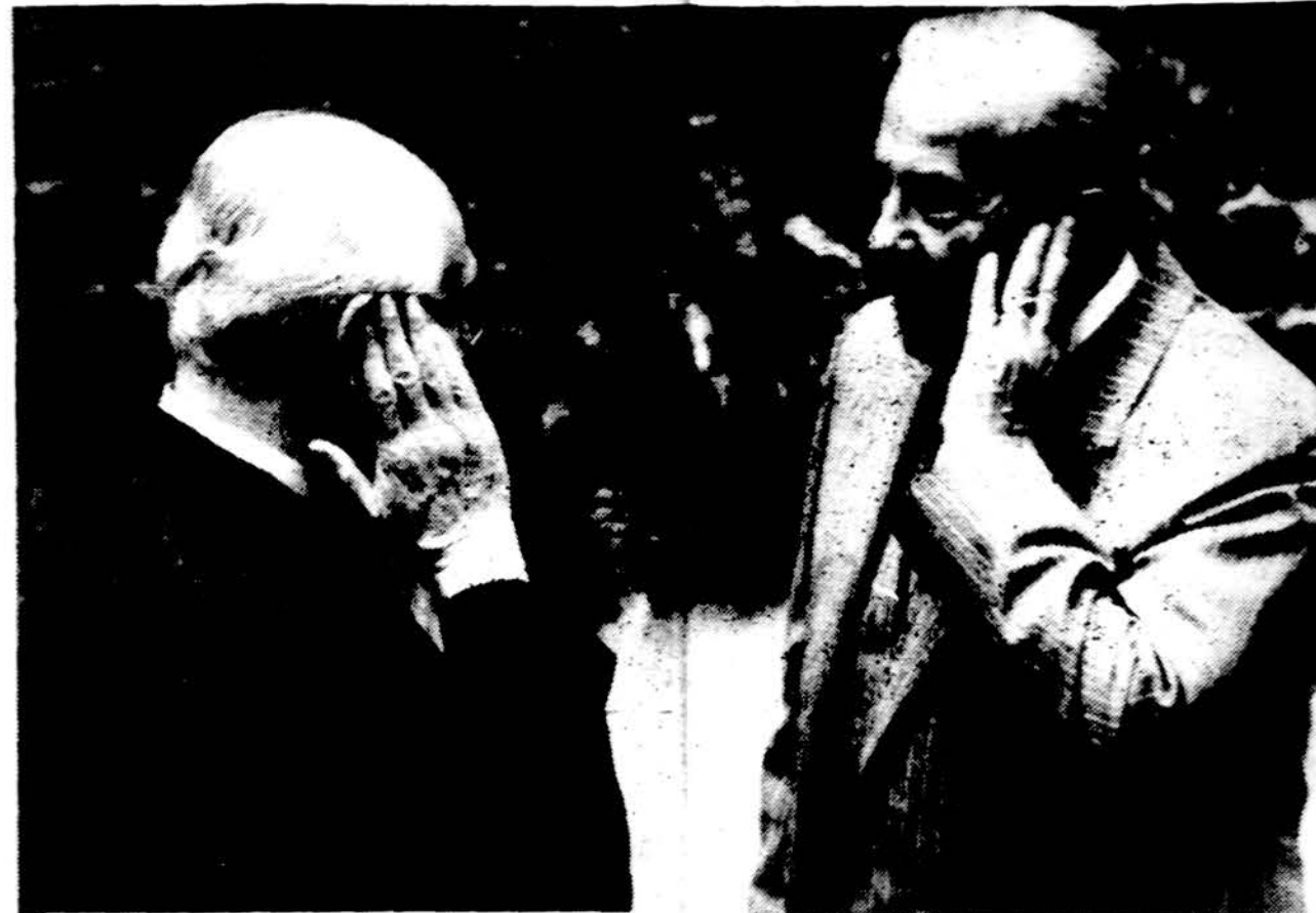
Valstybės sekretorius George Shultz Helsinkyje kalbasi su Sovietų Sąjungos ambasadoriumi Washingtono Anatolijum Dobryninu.