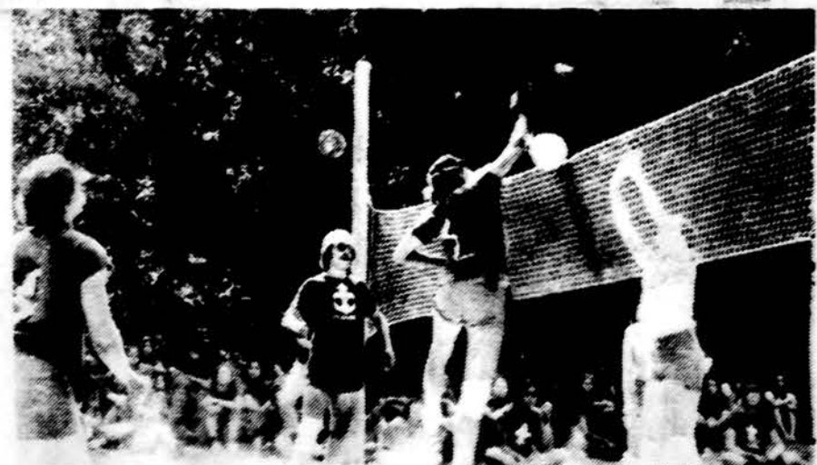
Tinklinio žaidynes skautų stovykloje Rake.

Odesoje vyko pirmųjų Sov. Sąjungos jaunių žaidynių dviračių sporto varžybos. Čempionu tapo Klaipėdos vidurinės mokyklos mokinys.