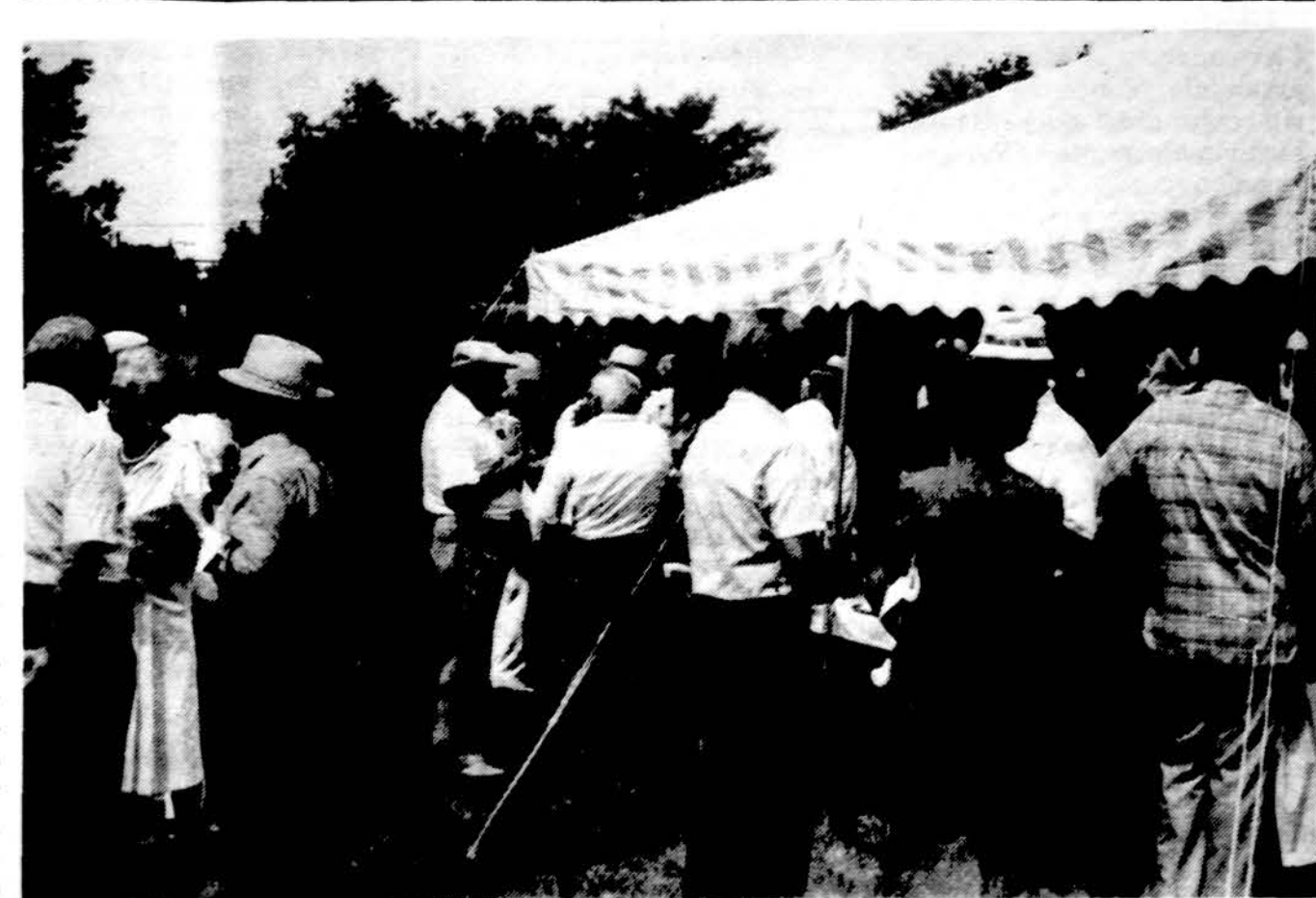
„Draugo“ dienraščio gegužinėje liepos 21 d. svečiai po palapinę sėpiasi nuo saulės...