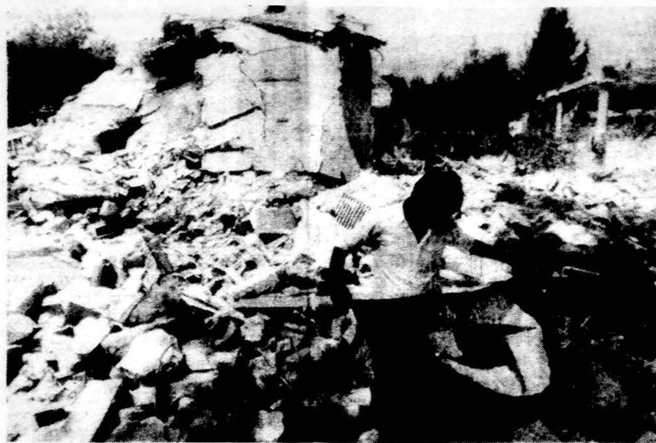
Izraelio lėktuvai sudaužė Libane Sirijos nacionalistų partijos štabo pastatą. Nuotraukoje sirų partijos narys išneša iš griuvėsių partijos vėliavą. Sirų nacionalistai siekia prijungti prie Sirijos visą Izraelį ir kaimyninių arabų valstybių žemes.

— FBI paskelbtų statistikoj daugiausia žmogžudysčių įvyksta Gary, Ind. mieste. Antras žmogžudysčių sąrašas eina Detroitas.