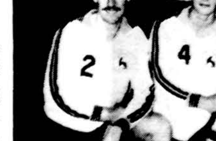
Baltimorės Lietuvių Atletų klubo vyrų tinklinio komanda dalyvavusi XXXV-tose SALFASS žaidynėse.