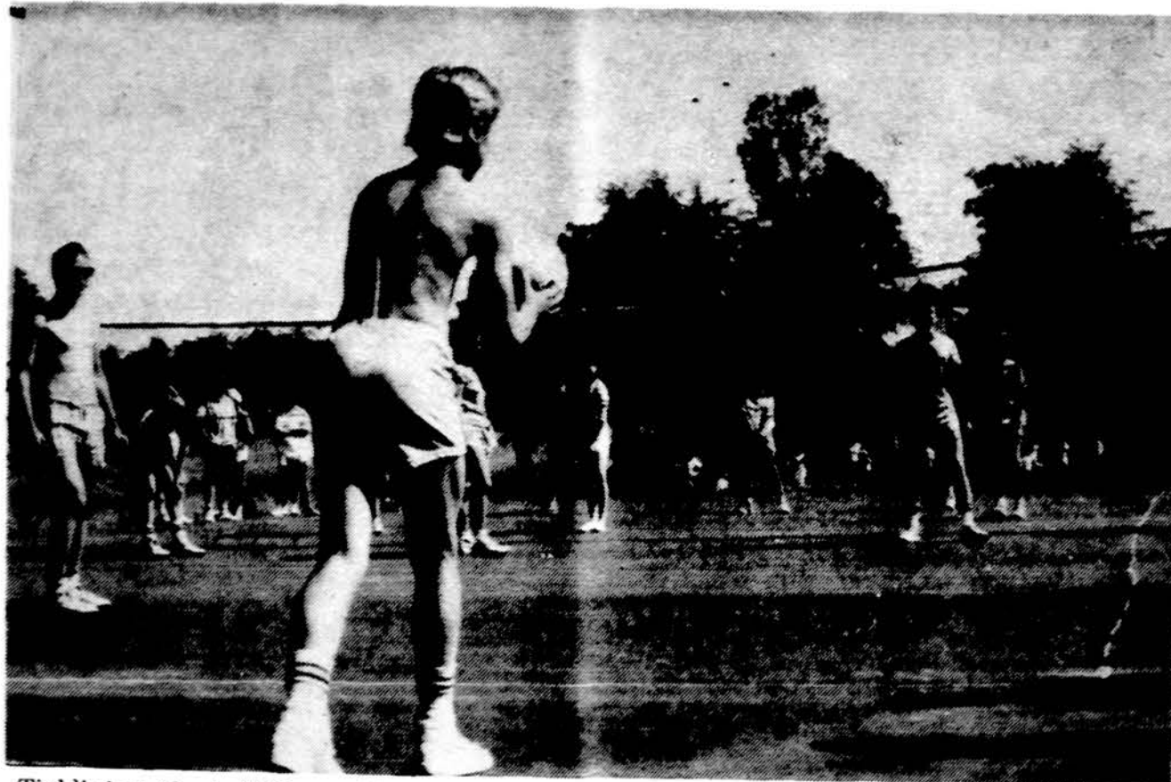
Tinklinio žaidynės MAS stovykloje Dainavoje.