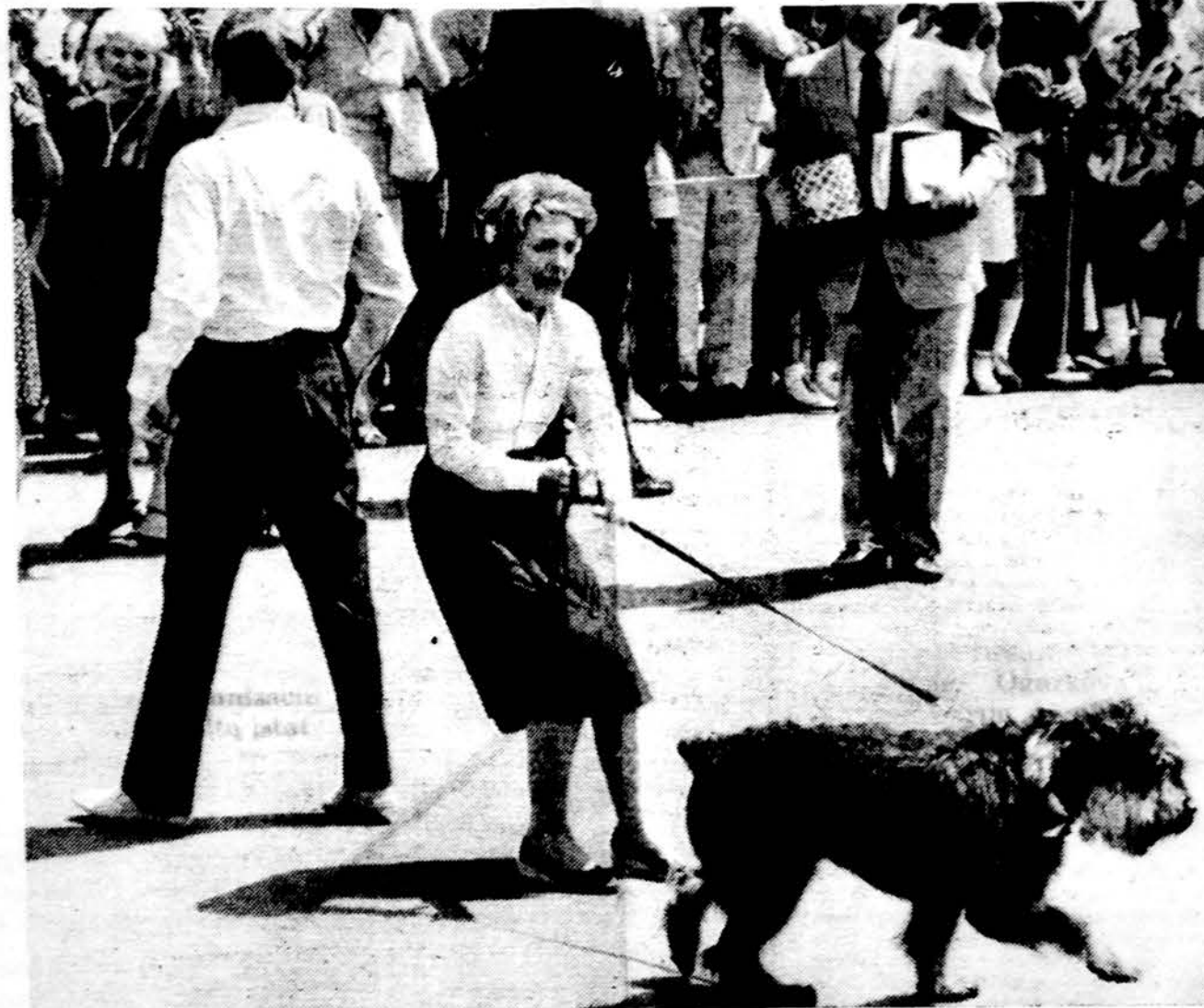
Prezidentas Reaganas ir ponija Nancy Reagan Baltųjų Rūmų sodelyje, apsupti reporterių ir palydovų, jiems išvykstant helikopteriu į Camp David. Stebėtojai sako, kad prezidento Reagano nenori klausyti demokratų dominuojami Atstovų rūmai. Poniai Nancy dar blogiau, — jos nenori klausyti ir gerokai paaugęs šunelis „Lucky“.

Vatikano spaudos atstovas J. Navarro Valls pasakė, kad Afrikos kontinente mažai visiškų bedievių, visi žmonės tiki į Dievą ar į daugelį dievų. Stipriausias katalikų konkurentas yra islamas, kurio išpažinėjų iš 531 milijono gyventojų yra 150 mil. Libijos diktatorius Khaddafi yra pasakęs, kad vieną dieną visa Afrika bus musulmonų tikėjimo.