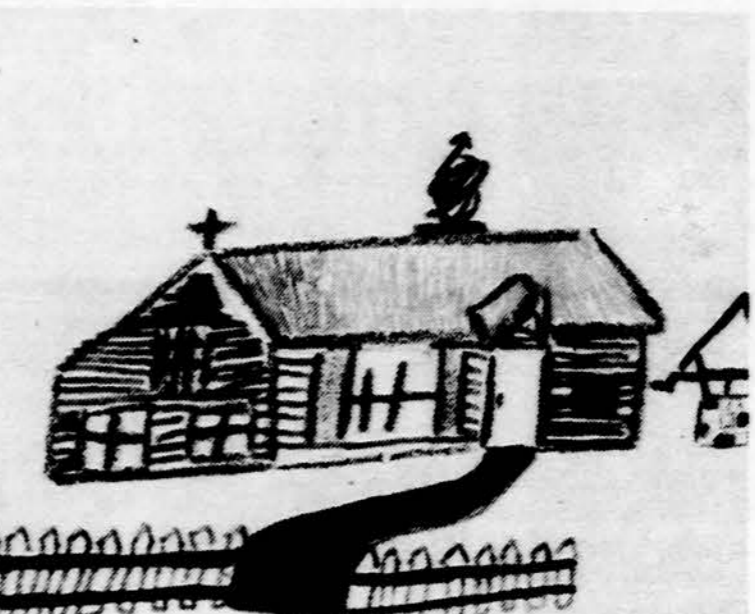
Lietuvos bažnytelė. Daug lietuviškų mokyklų mokslo metus pradeda pamaldomis. Piešė Vydas

„Lietuvaitė davė viską, ką gamta per ilgus tūkstantmečius kūrė: Akims — melsvumą ežerų,