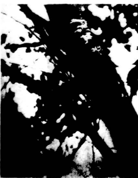
Genys ieško maisto, kad sustiprintų savo kūno jėgas. Lietuvių vaikai eina į lietuvišką mokyklą, kad sustiprintų savo proto jėgas.

Yr žolė pro ligą, pro smertį nēr (Zolė nuo ligos, bet ne nuo mirties). Ko nežinom, to nenorim. Bepročio nereikia su žiburiu ieškoti, pats pasirodys (Sunkai). Jo kalbas ir į vežimą nesukrausi. Nuliūdo kaip žirgą par-davęs. Įduok kiauilei ragus — visą svieta išbadys. Nuilsio it šuo, varlę gines. Išsiskleidę lyg perkūno ūsai. Prie drašos reik ir galios. Atsimuša kaip žirniai į sieną (Joniškis). Gale lauko pragarai liepsnoja (Liudvinavas) (Saulė teka). Pušis langą užgulė (Rimšė) (naktis). Eina per vandenį — neteksi, eina per žemę — pedų nedaro. (Šešėlis). Aukso mesta, sidabru atausa, deimanto peiliu rėta. (Vaivorykstė). Kada tai nusiduos (atsitiks)? — Kada kuolai žaliuos. Perkūne dievaiti, nemuški manęs, Dievą melsiu, į tave paltį (lašinių gabalą) mesiu.