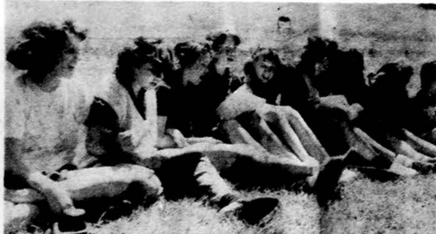
Stovykloje smagu dainuoti.

Rugpjūčio 20 d. Vidurio rajono vado v.s. A. Pauzolio namuose įvyko jo koordinuojamas Chicago tuntininkų posėdis, kuriame buvo aptarti įvairūs praėjusios stovyklos reikalai. Taip pat buvo bendrais bruožais aptarti 1985/86 veiklos metų įvykiai ir darbai. Nustatytos datos kai kuriems visiems tuntams bendriems įvykiams. Bendru nutarimu visų tuntų pirmosios šio rudens sezono sueigos prasidės rugsėjo 14 ir 15 dienomis.