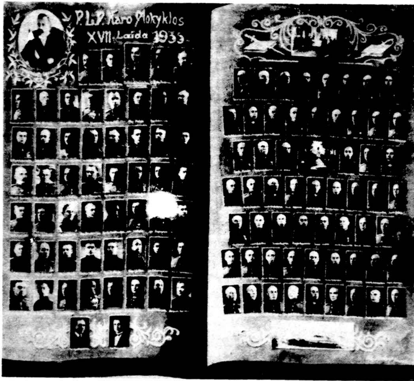
PLB. Karo mokyklos XVII laidos karininkai su viršininkais ir lektorais. Prieš 50 metų baigė 58 karininkai. Šiandien iš jų yra gyvų ir išblaškytų po pasaulį 17. Išvežtų į Sibirą 12, žuvusių ar nužudytų 8, mirusių 7, o kitų 13-kos likimas nežinomas.