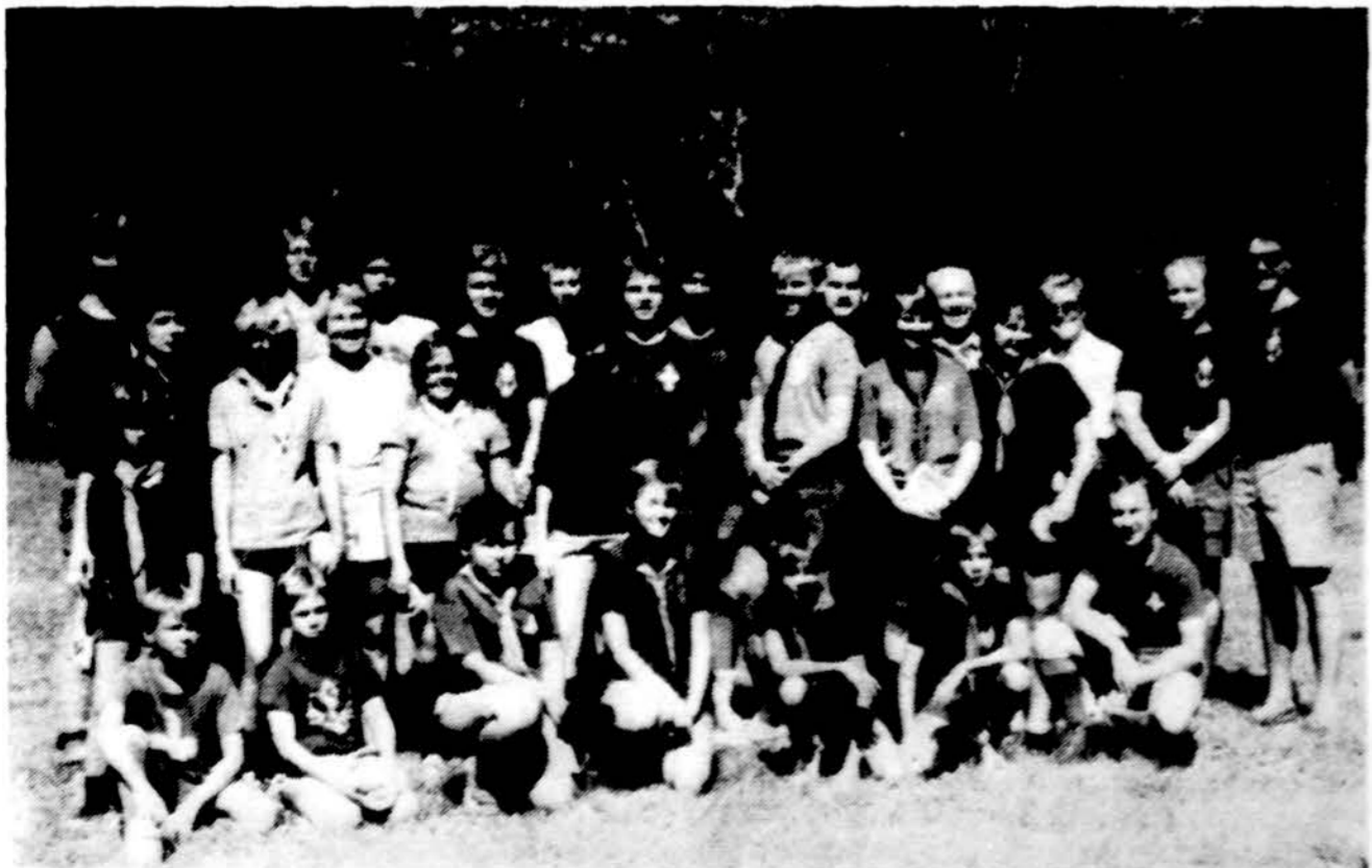
Clevelando skautai ir skautės šios vasaros stovykloje.