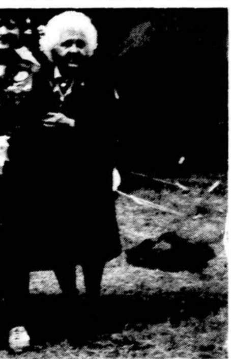
„NERIJOS“ TUNTAS KVIEČIA