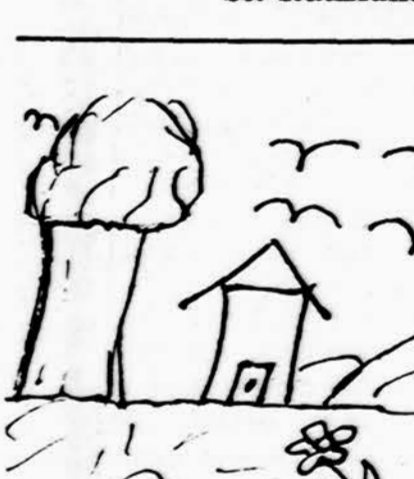
Piešė Raimundas Novak, I sk. K. Donelaičio lit. m-la.

Gina, gins, šimtmečius gynė Lietuvą jos naršus sūnūs. Kentės, mirs už ją — tėvynę — Kolei išvys atėjūnas — St. Radžiūnas