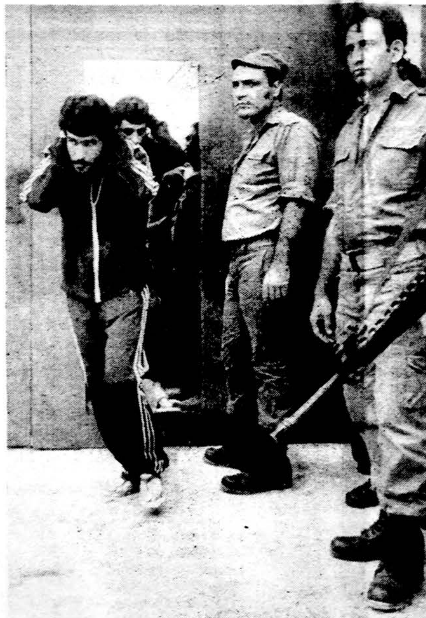
Israelis paleido paskutinius koncentracijos stovykloj kalintus libaniečius, viso 119 vyrų, Israelis laikė 766 Libano piliiečius, kurių laisvės reikalavo birželio 25 d. keleivinio TWA lėktuvo grobikai.