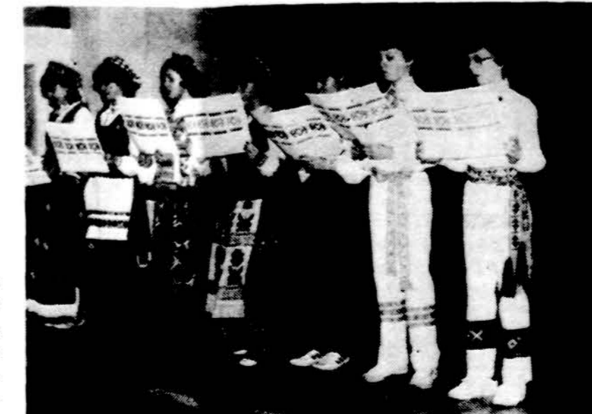
Dariaus Girėno mokyklos mokiniai deklamuoja.