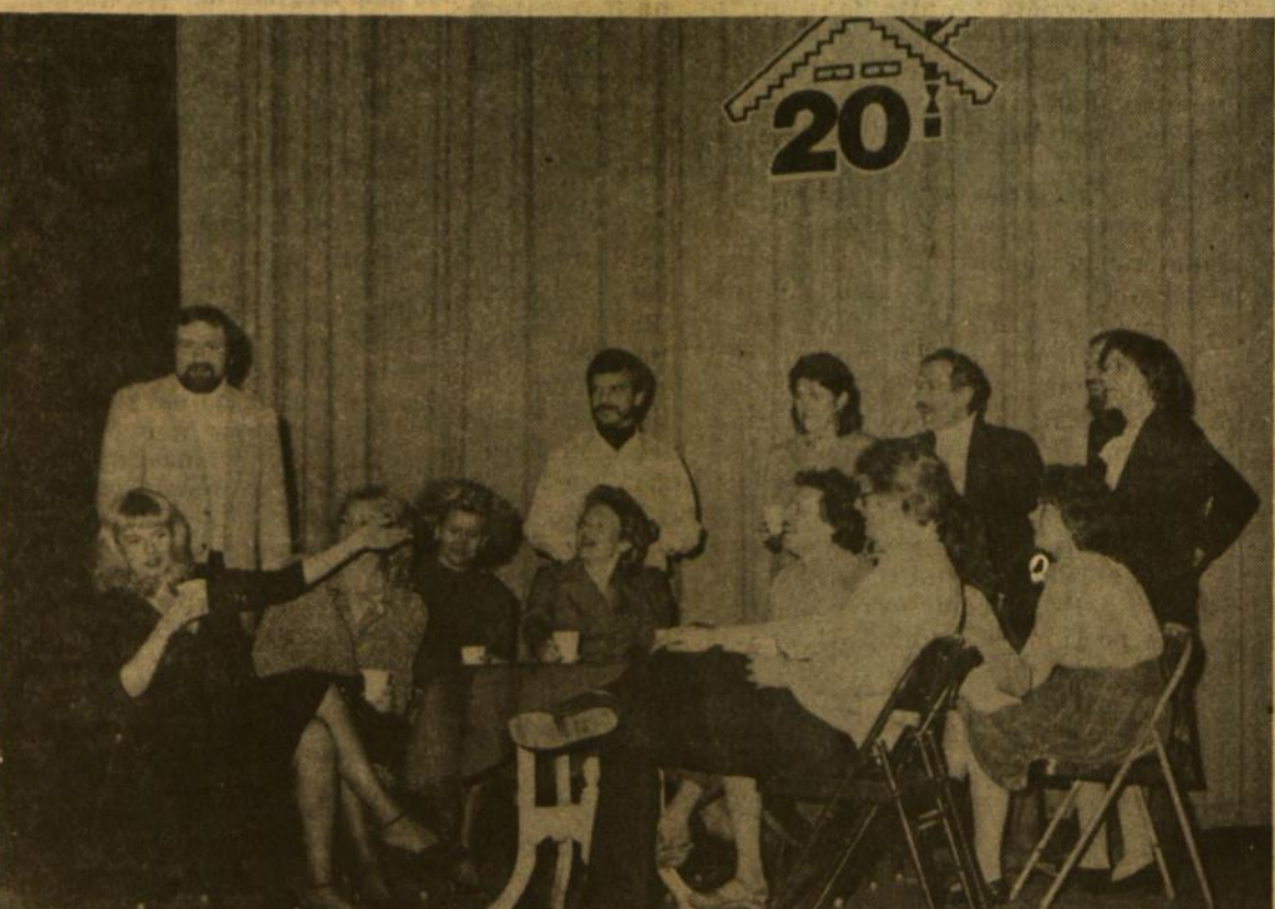
Iš Antro kaimo 20 metų sukaktuvinio spektaklio 1984 m. vasario mėn. 4-5 d. Jaunimo centro scenoje, Chicagoje.