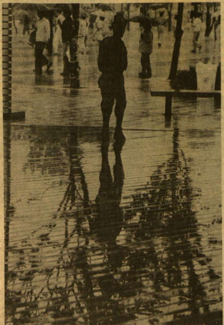
Expo '85 — skulptūra ir minia. Tsukuba, Japonija.