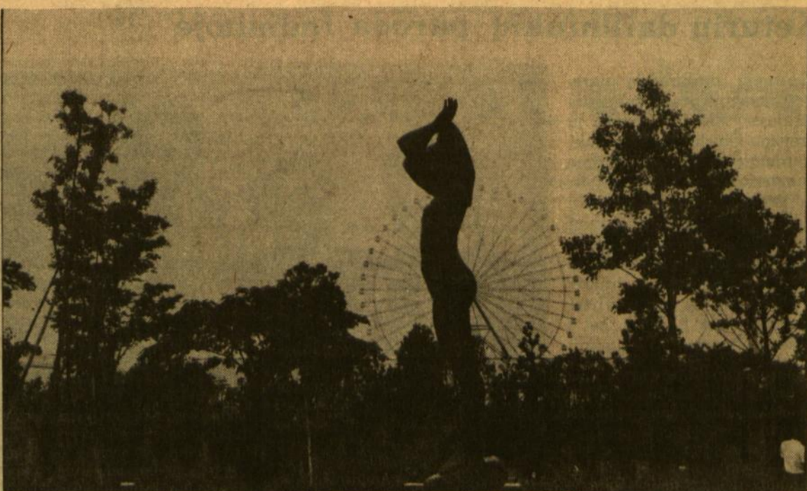
Skulptūra parodoje Expo '85, Tsukuba, Japonija.