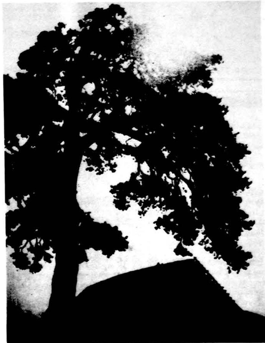
Tylus ir ramus vasaros vakaras laisvoje Lietuvoje.