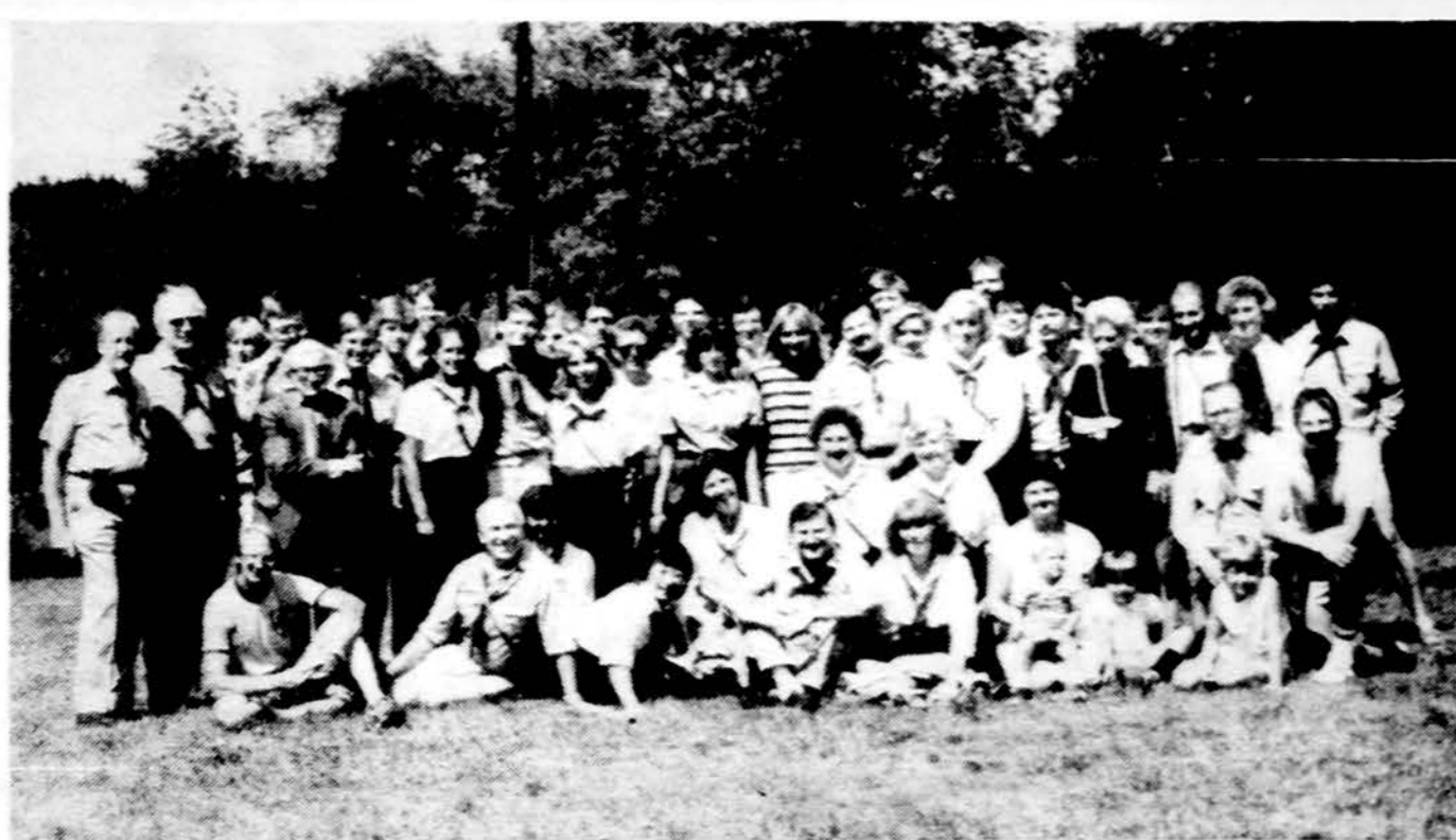
Skautai akademikai po studijų.

Kitas iškeltas rūpestis buvo, kad lietuviams ir lietuvių bendruomenėje trūksta