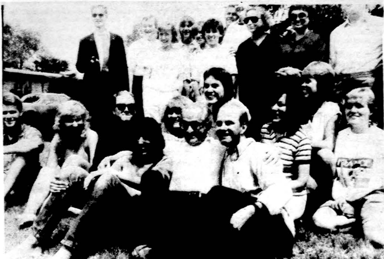
Dalis gerai nusiteikusių lituanistikos seminaro kursantų ir lektorių.

Neįmanoma išklausti lituanistikos kursą? Tuo atveju bent įsikvite į Lietuvos studentų veiklą. Visi kviečiame prisidėti prie klubo veiklos savo entuziazmu ir idėjomis. Laukiame jūsų!