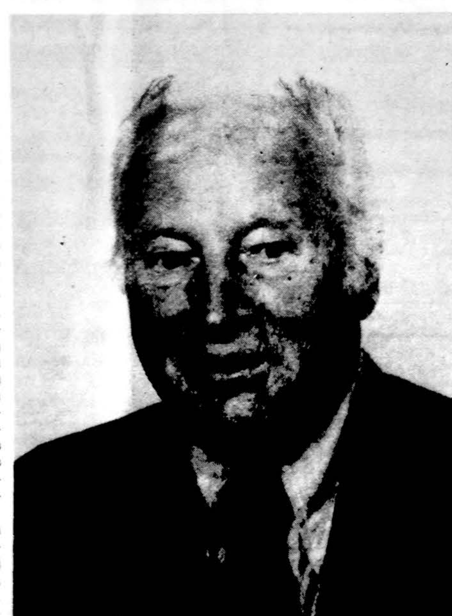
Žurnalistas Stasys Pieža