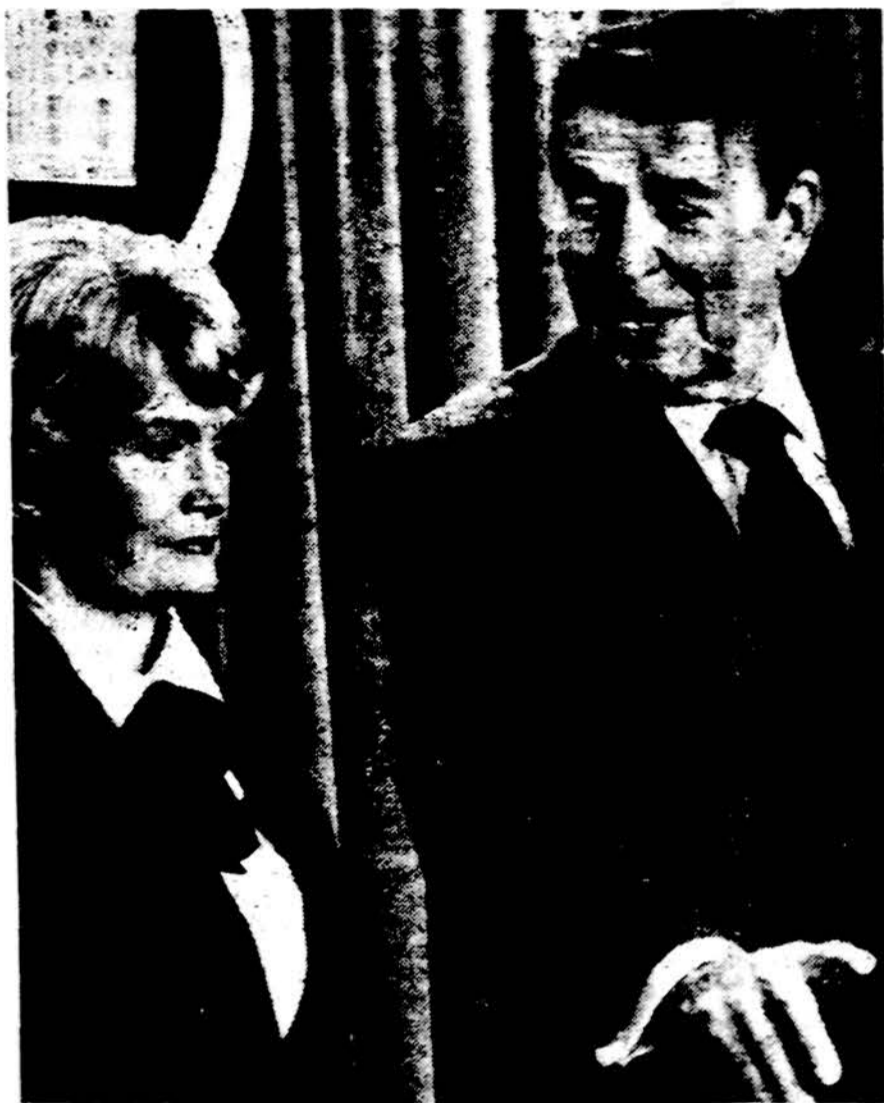
Prezidentas Reaganas ir sveikatos, žmonių patarnavimų departamento sekretorė Margaret Heckler. Prezidentas paskelbė, kad ji paskirta ambasadore Airijoje. Ji sutiks pasitraukti iš vyriausybės, kur ji puikiai dirbusi. Prezidentas paneigė spaudos skelbiamas žinias, kad jis buvo nepatenkintas jos darbu sveikatos departamente.