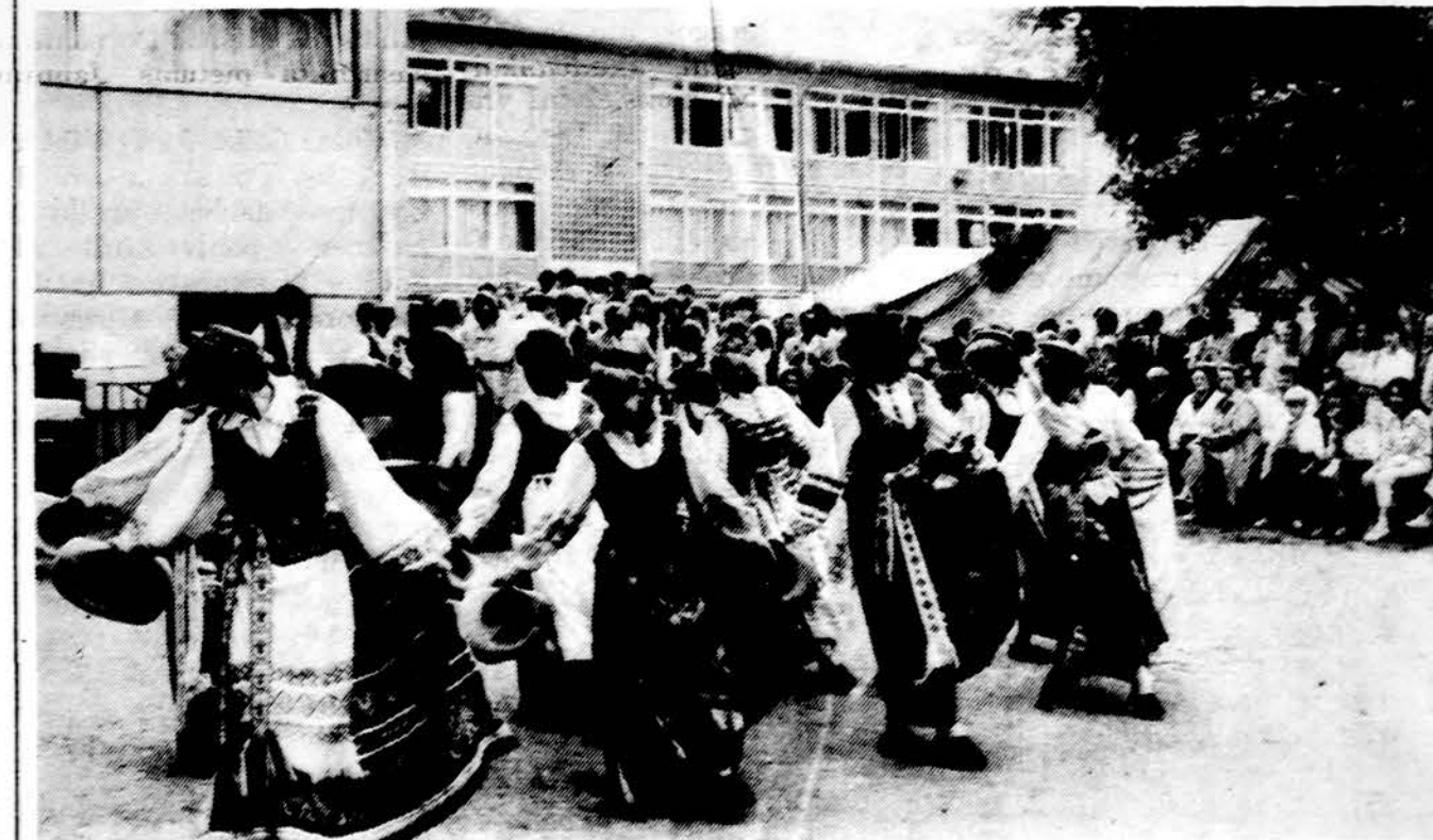
Vasario 16 gimnazijos Vokietijoje tautinių šokių grupė sveikina atvykusius svečius į Joninių šventę.

Kaip matome šis ukrainiečių vyskupų sinodas tars savo žodį įvairiais gana painiais klausimais, kurie liečia Ukrainos katalikų Bažnyčią. Jo darbo vaisiai paaiškės, kai baig-