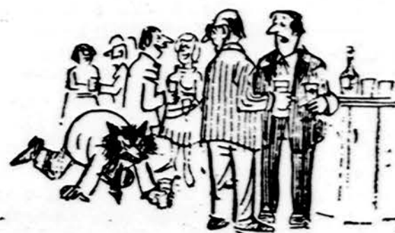
— Man labai įdomus tas atvejis. Po poros čierkelių jis virsta žvėreliu. Iš britų spaudos