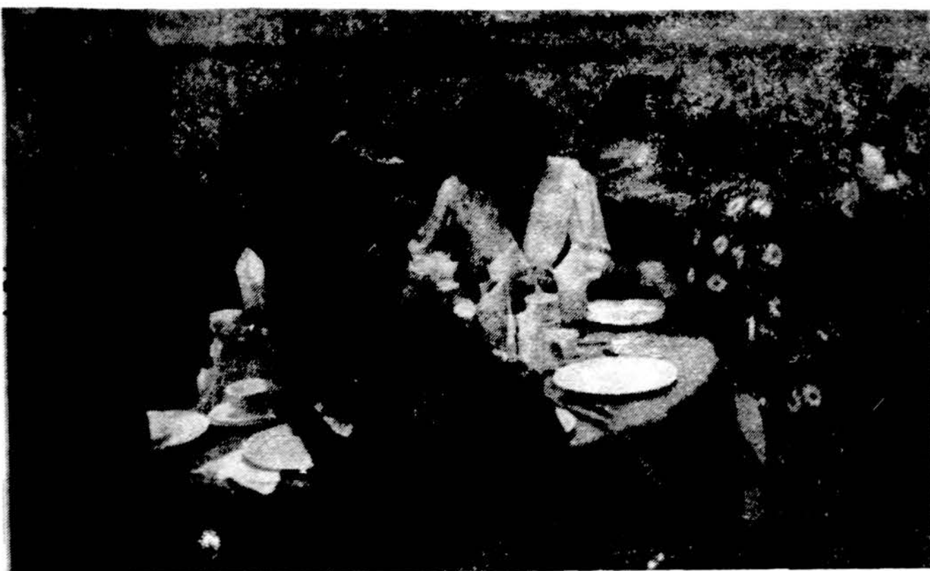
„Draugo“ draugų vienas iš stalų metiniame bankete Jaunimo centre rugsėjo 28 d.

x Baltic Monuments, Inc. , 2621 W. 71 Street, Chicago, Ill. Tel. 476-2882. Visų rūšių paminklai, žemiausios kainos, geriausiomis sąlygomis. (sk.)