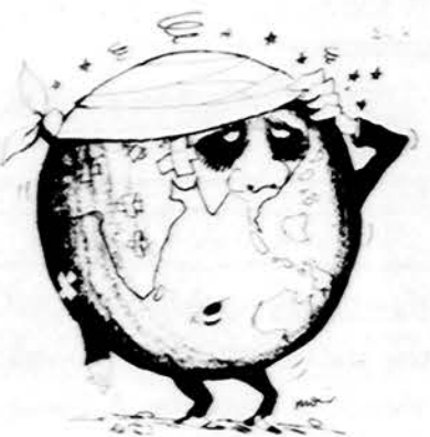
Iš australų spaudos

— Tikra teisybė. Pasirašau. — O kaip tamstai einasi? — Šiandien gerai, rytoj dar geriau. — Taip guodžiamasi ir Sovietų Sąjungoj, tik ten atvirškiai sako: šiandien geriau negu rytoj. — Kaip du kart du keturi. — O kaip oras pas jus? — Nei šilta, nei šalta. — Pas mus oro biuras žadėjo lietaus. Galimybė yra penkiasdešimt procentų. — Vadinas, lis, arba nelis. — Genialus išpranašavimas. Biuras vėl galės į savo knygas įrašyti, kad orą įspėjo šimtu procentų. — Tikra teisybė. — Rodos jau būsime apie viską išsišnekėję. — Ir man taip rodos. — Buvo labai malonu pasišnekėti. — Paskambink kitą kartą. — Ačiū už gerus žodžius. Linkėjimai. — Linkėjimai kam? — Visiems kaimynams. — Labai dėkui. — Iki kito karto.