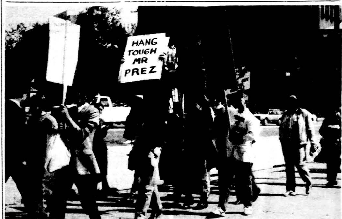
Lietuviai, latviai, estai, ukrainiečiai, afganistaniečiai demonstruoja prieš Sovietų Sąjungos užsienio reikalų naują ministrį Šavardną, jam einant į Baltuosius rūmus.