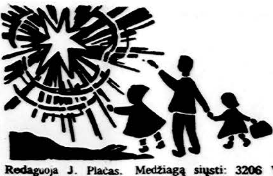
Redaguoja J. Placas. Medžiagą siųsti: 3206 W. 65th Place, Chicago, IL 60629

x Šv. Jurgio parapija , 911 W. 32nd Place, ruošia metinį „Octoberfest“ šeštadienį, spalio 12 d., nuo 5:30 val. po-piet iki 12:00 val. vakare. Bus įvairūs žaidimai, loterijų traukimai, skanūs valgiai ir muzika. Įėjimas $2.00 su-augusiems ir $1.00 vaikams. Visi kviečiami atsilankyti ir smagiai praleisti vakarą. (pr.)