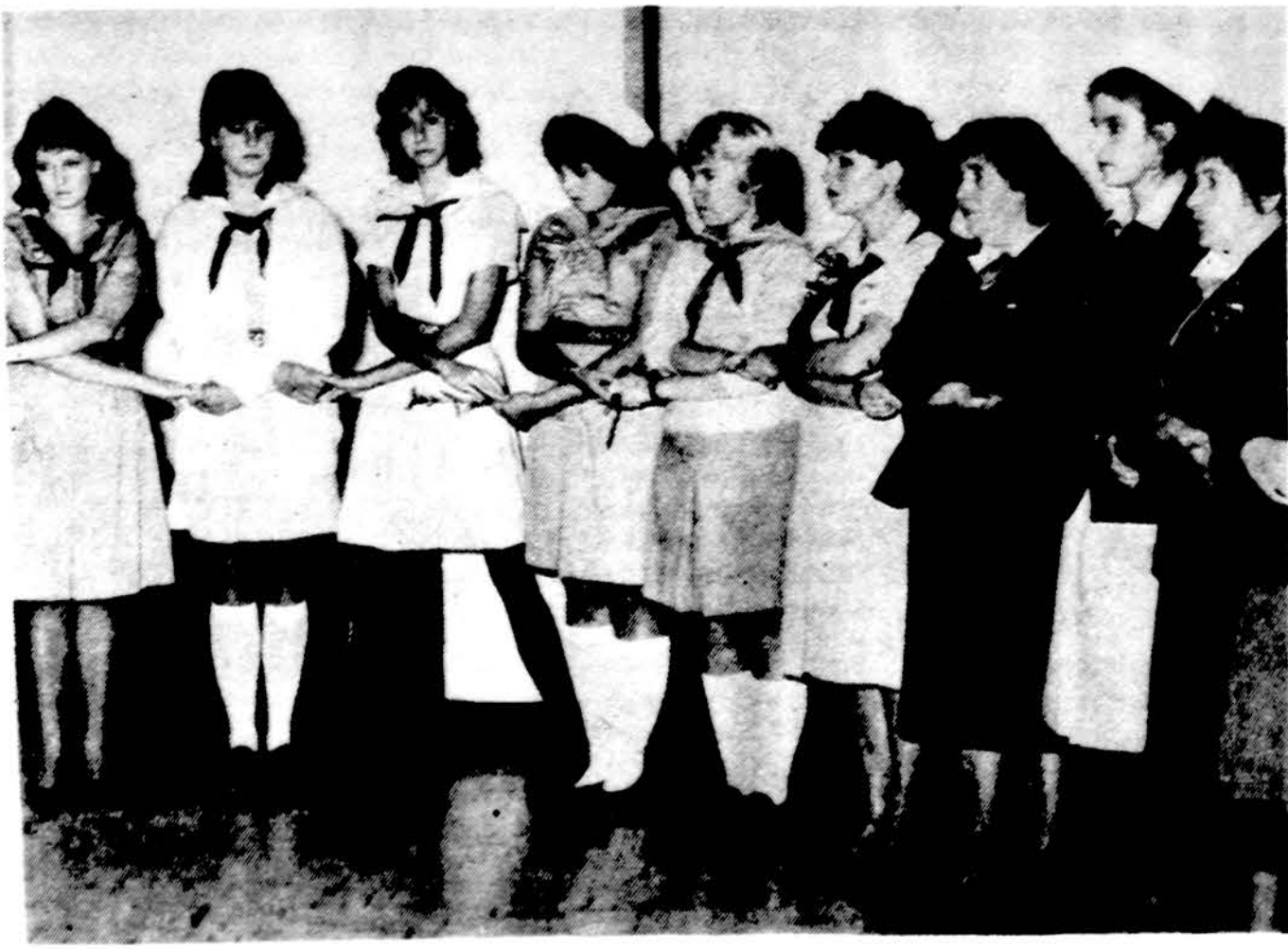
Giesmė baigiama „Nerijos“ tunto sueiga.

GYDYTOJAS IR CHIRURGAS 6745 West 63rd Street Val. pirm., antr. ketv. ir penkt. 3-6; šeštadieniais pagal susitarimą