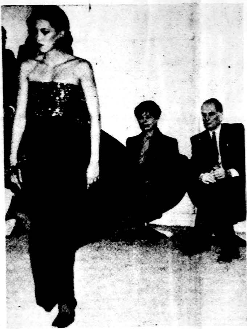
Paryžiuje sovietų komunistų partijos gen. sekretoriui Gorbačioviui posėdžiaujant su vyriausybės nariais, jo žmona Raisa lankėsi rūbų salionuose, apžiūrėdama naujausias Paryžiaus madas. Nuotrauką ji sėdi su garsiu designeriu Pierre Cardin.

Kalinio išlaikymas buvo labai pigus. Jį rengdavo suplysusiais, daug kartų lopytais drabužiais. Maistas buvo prastas: iš blogiausios kokybės produktų, bet ir tokio trūko. Oficialus darbo laikas — 10 val. Tačiau kalinį galėjo išvaryti į darbą bet kada: sekmadienį, per šventę, galėjo užtraukti darbo laiką, nes tai priklausė nuo konclagerių administracijos. Tai reikia įvykdyti gamybinį planą, tai baigti skubią užduotį ir todėl poilsio kaliniams ir sekmadienį neduodavo. Atostogų kaliniai neturėdavo, ir privalejo vilkti jungą iki nugais. Kalinių darbą neskaitė prie darbo žmogus, senatvėje, jeigu žmogus jos sulauks ir išeis iš lagerio, pensijos negaus. Kadangi kalinių buvo dešimtys milijonų, tai valstybė turėjo didžiulį pelną vien už tas papildomas valandas (įgyrįnant su laisvojo darbininko 8 val.), už neduodamas atostogas, už nemokamas pensijas, neatlygintus sulošimus. Dirbo kasyklose bei fabrikuose ir aukštos kvalifikacijos specialistai, kurie turėjo būti brangiai apmokami, o valstybei jie nieko nekainavo. Bolševikai visokiais būdais stengėsi priversti kalinius kuo daugiau dirbti. Jie griebėsi bauminių ir paskatų. (Bus daugiau)