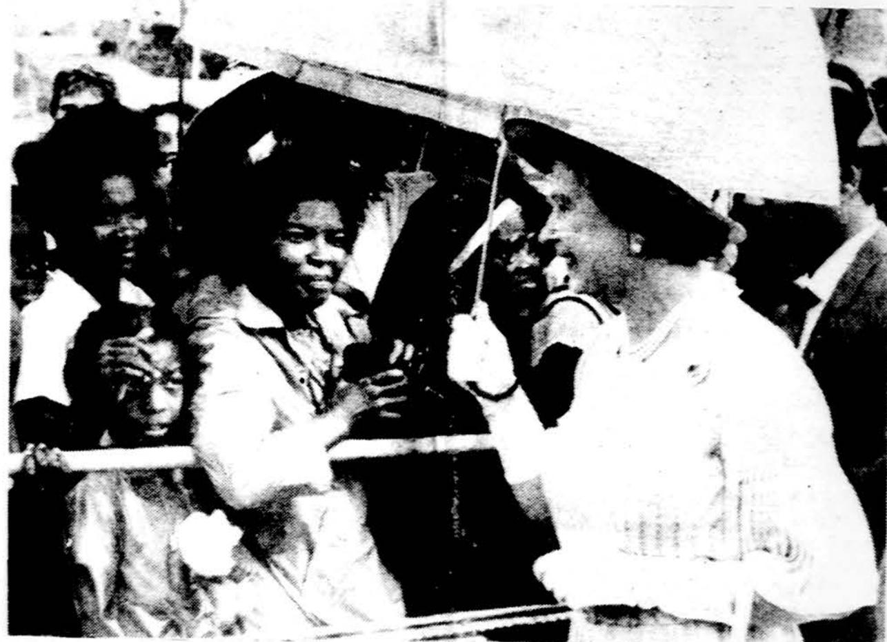
Britanijos karalienė ketvirtadienį lankėsi Grenados saloje, tuo simboliškai pabrėždama, kad padėtis saloje normali. Amerikos įsikisimas 1983 m. spalio 25 d. išgelbėjo salą nuo komunizmo diktatūros.

Venecijoje žiomis dienomis vyksta Italų katalikų gydytojų sąjungos visuotinis kongresas, kuriam šiais metais yra parinkta tema: