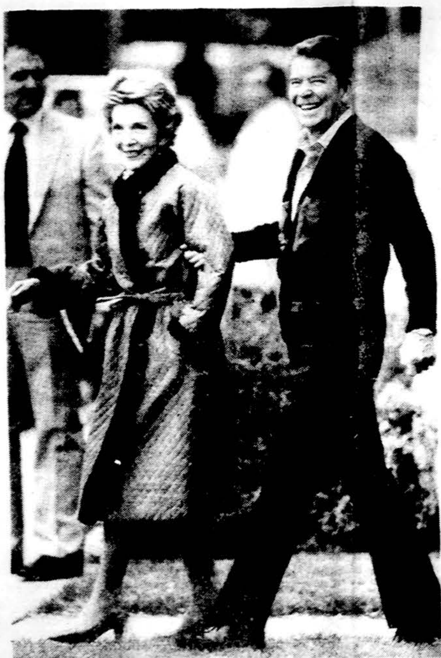
Prezidentas Reaganas su žmona Nancy lapkričio 1 d. išeina iš jų laivyno Bethesda ligoninės Marylande. Gydytojai apžiūrėjo prezidentą ir nustatė, kad jo sveikata normali. Korespondentas prezidentas pasakė, kad jis jaučiasi 100 metų sveikas.

— Erdvės ir aeronautikos administracija paskelbė, kad bus išrinktas žurnalistas atstovas ir skris į erdvės orbitą ateinančių metų rudenį. Specialios žurnalistų komisijos išrinko po aštuonis kandidatus iš penkių geografinių regionų. Iš kandidatų bus išrinkti du, kurie pradės treniravimą.