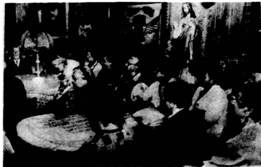
Lietuviai pensininkai klausosi sveikatos reikalu pranešimo Alvudo pažmonyje Lietuvio sodyboje.