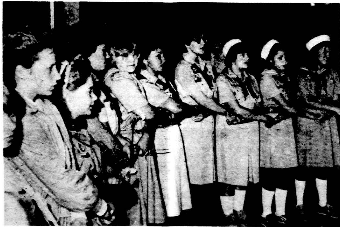
Baigiama iškilminga „Nerijos“ tunto sueiga.