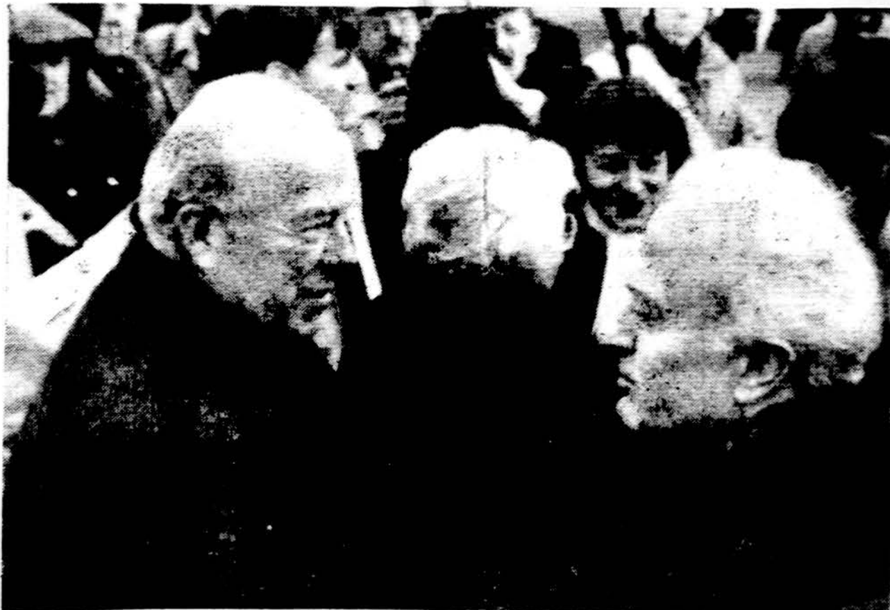
Valstybės sekretorius George Shultz Maskvos aerodrome sveikinasi su sovietų užsienio reikalų ministru Eduard Shevardnadze.

— Egiptas, kuris tapo nafta eksportuojančia valstybe, paskelbė naftos kainų pakėlimą nuo 25 iki 45 centų už statinę.