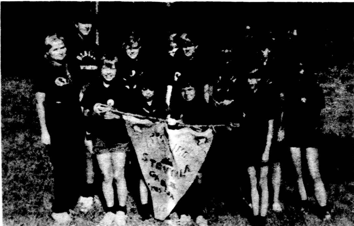
Detroito paukštytės stovykloje Dainavoje.

1966 m. pradėjęs veikti skautų taut. šokių vienetas „Pašvaistė“, vadovaujamas R. Zotovienės, šokęs Vasario 16 minėjimuose, kitų organizacijų renginiuose, bei repre-