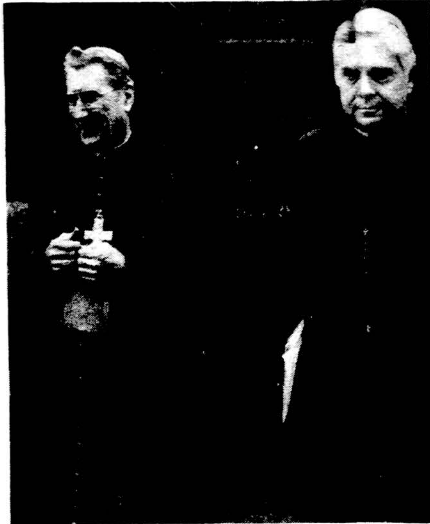
JAV kardinolai: New Yorko arkivyskupas John O'Connor ir Bostono arkivyskupas Bernard Law atvyko į Romą, kur vyksta Kardinolų Kolegijos posėdis. Sekmadienį bus atidarytas Vyskupų Sinodas.