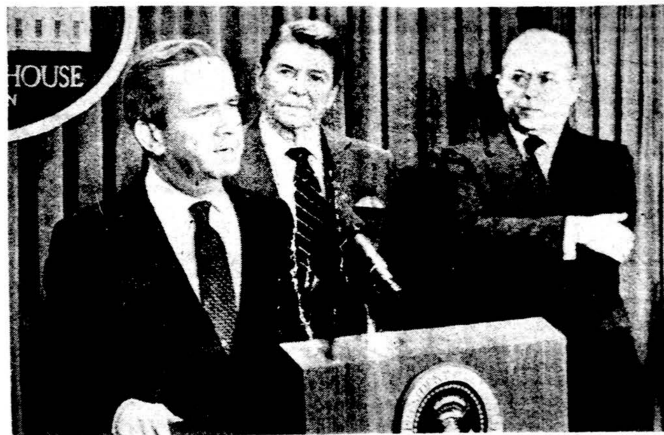
Buvęs valstybės saugumo patarėjas Robert C. McFarlane atsiseivkina su reporteriais Baltuosiose Rūmuose. Viduryje — prezidentas Reaganas, dešinėje — naujasis prezidento patarėjas, admirolas John M. Poindexter.

Kritikai klausia, ką gali pagalvoti prispausti lenkai, kada jie mato Lenkijos televizijoje karinį diktatorių Jaruzelskį su Prancūzijos, tradicines lenkų tautos draugas, prezidentu? Generolas Jaruzelskis norėjo paplaukioti Senos upe, tačiau turistinių laivų bendrovės vadovybė atsakė jį priimti į savo laivą. Jį priėmė mažesnė laivų bendrovė. Viena prancūzų solidarumo su Lenkija organizacija pasiuntė prezidentui Mitterandui juodus akinius, panašius į