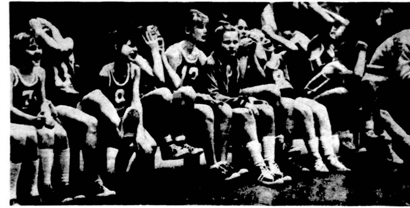
Saulių „Tauro“ jaunosios žaidėjos jaudinasi stebėdamos žolės riedulio rungtynes.