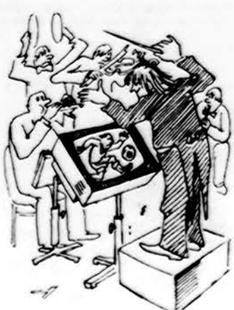
Iš sovietinės spaudos