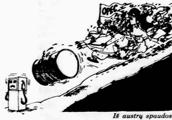
Iš austrų spaudos

Jei žmogus neturi kuo pasigirti, pradeda girtis nors savo ligomis.