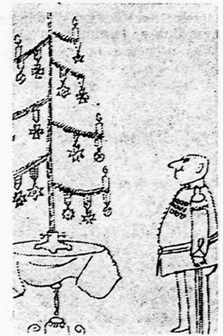
Kai dovanų per daug, kai nieko netrūksta, žmogus pradeda trokšti tokių dzinguliukų.

O čia iliustracijai sekimas praktiškumo pavyzdys: didžiulėj Marshall Field kompanijai skyrių bendradarbiai Kalėdoms kasmet sudeda bosui ar bosei po penkis dolerius. Bosas ar bosė laimingi, dėkoja, džiaugiasi. Kitą dieną bosas ar bosė visiems išdalina po sveikinimo vokelį, kur įdėta po penkinę. Dabar ir tarnau-tojai džiaugiasi gavę dovaną. Visi laimingi, patenkinti. Svarbiausia, kad niekam jokių išlaidų ar nuostolių. Nei davėjui, nei gavėjui.